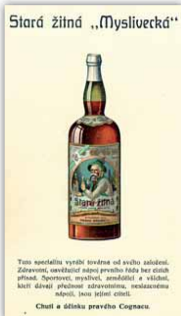
Z ilustrovaného ceníku, rok 1927.