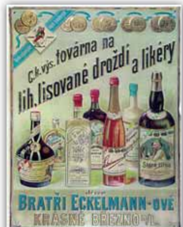
Reklamní tabule, rok 1900.

lické závody droždářské a lihovarské a Mostecké závody lihovarské, dále Likérky Liboucheč, Česká Kamenice, Děčín, Turnov, Kraslice, Kadaň, Karlovy Vary (Becherovka), Chomu-