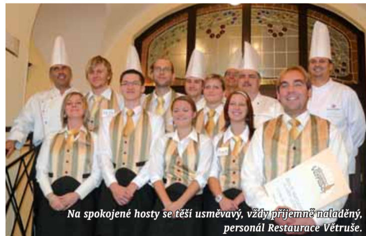
Na spokojené hosty se těší usměvavý, vždy příjemně naladěný, personál Restaurace Větruše.