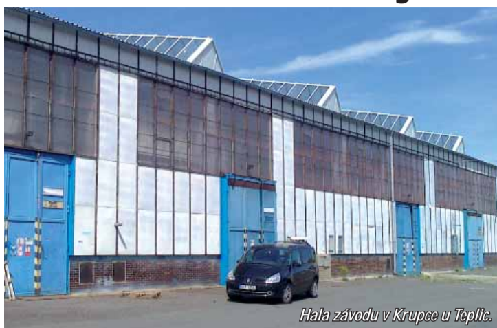
Hala závodu v Krupce u Teplic.

Díky vysoké kapacitě plně automatizovaného procesu azvyšeným výkupním cenám meziprojektu tříděných PET lahví na průměrných 8,48 korun za kilogram dosáhne výroba objemu tržeb v řádu 50 - 60 milionů korun ročně. Při nákupní ceně vstupní suroviny 4,20 Kč/kg pak marže činí min. 25 mil. Kč ročně a zisk 8-9 mil. Kč v první etapě. Na dodávku surovin a odbytu má firma předjednané dodavatele a odběratele a podepsané rámcové smlouvy. V druhé etapě bude třídící linka rozšířena o vlastní recyklační linku, jejímž výstupem je PET regranulát s ještě vyšší obytovou cenou a přidanou hodnotou. Třídící linku vybuduje firma ENREI