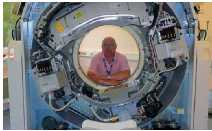
„S ROPem do 3. tisíciletí“

Na druhých místech se s úžasnými počty hlasů umístili Lucie Issezer (Sou-