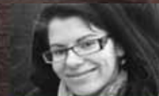
Lennie Výklad karet