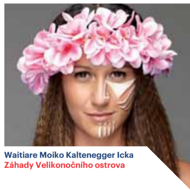
Waitiare Moiko Kaltenegger Icka Záhady Velikonočního ostrova