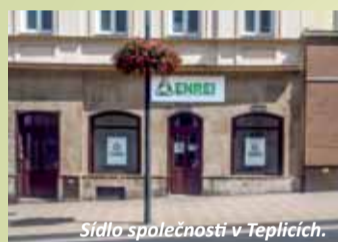
Sídlo společnosti v Teplicích.