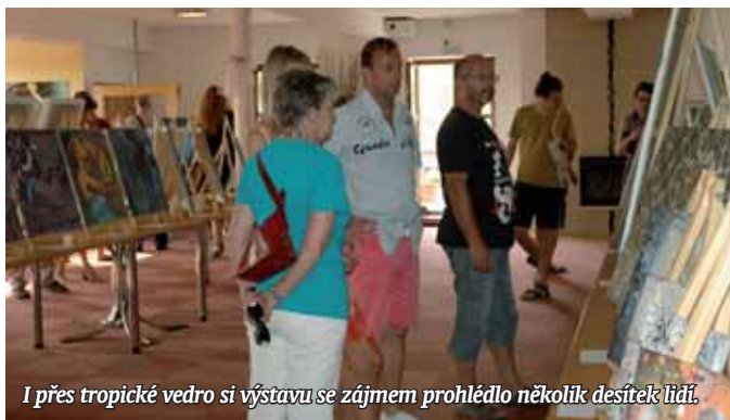
I přes tropické vedro si výstavu se zájmem prohlédlo několik desítek lidí.