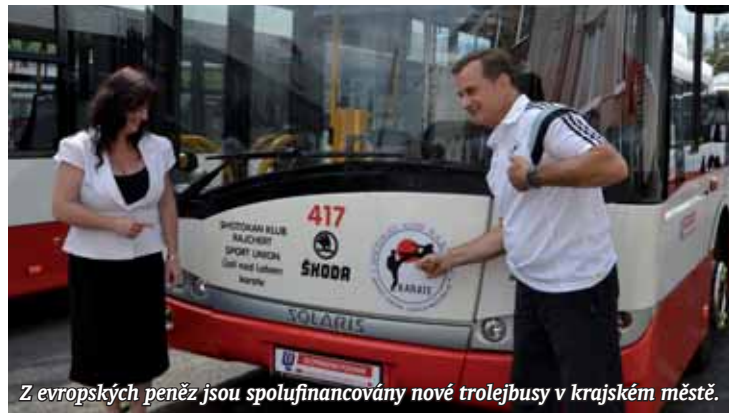
Z evropských peněz jsou spolufinancovány nové trolejbusy v krajském městě.