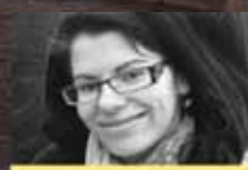
Lennie Výklad karet

Astrodom Výklad karet, horoskopy, esoterika