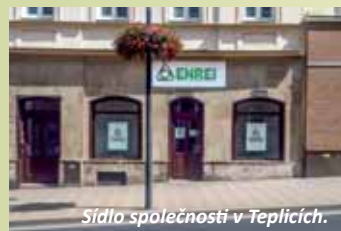
Sídlo společnosti v Teplících.