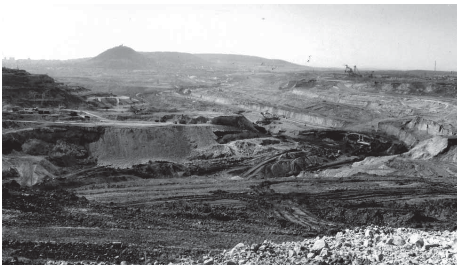
Pohled ze severu v minulosti...

Bližší informace najdete na www.jezero-most.cz nebo www.pku.cz