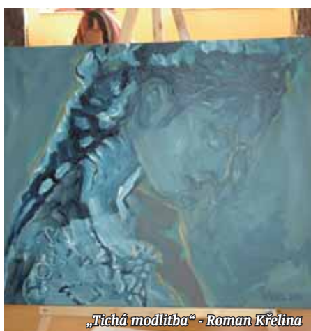
„Tichá modlitba“ - Roman Křelina