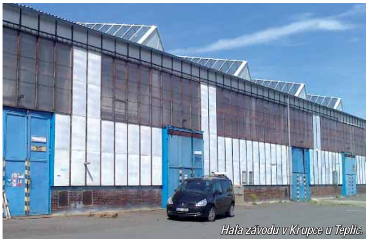
Hala závodu v Krupce u Teplíc.

Díky vysoké kapacitě plně automatizovaného procesu a zvýšeným výkupním cenám meziprojektu tříděných PET lahví na průměrných 8,48 korun za kilogram dosáhne výroba objemu tržeb v řádu 50 - 60 milionů korun ročně. Při nákupní ceně vstupní suroviny 4,20 Kč/kg pak marže činí min. 25 mil. Kč ročně a zisk 8-9 mil. Kč v první etapě. Na dodávku surovin a odbytu má firma předjednané dodavatele a odběratele a podepsané rámcové smlouvy. V druhé etapě bude třídící linka rozšířena o vlastní recyklační linku, jejímž výstupem je PET regranulát s ještě vyšší odbytovou cenou a přidanou hodnotou. Třídící linku vybuduje firma ENREI