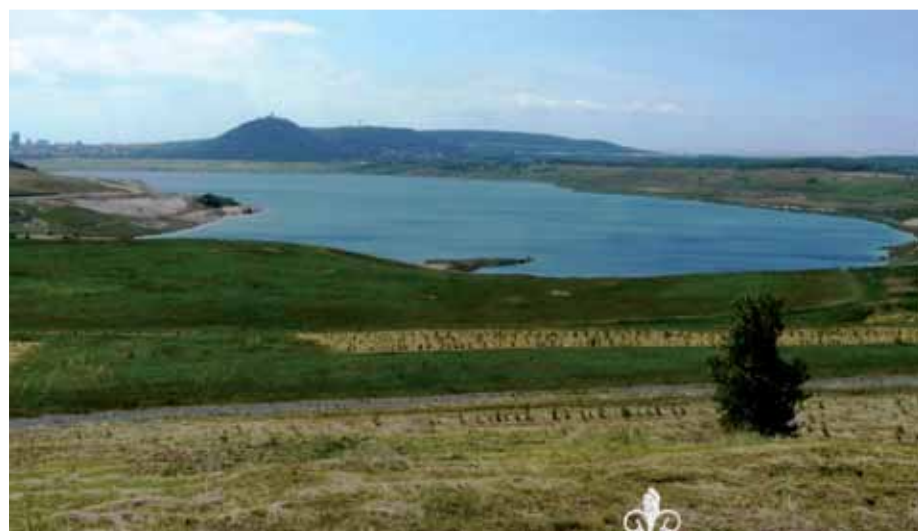
... a v současnosti.