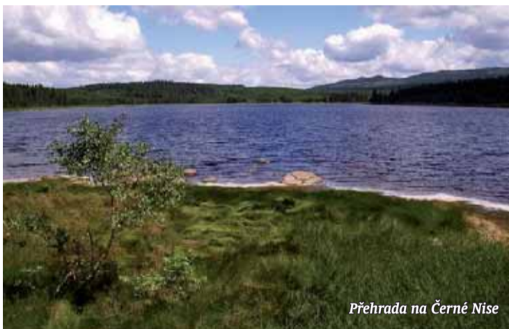
Přehrada na Černé Nise