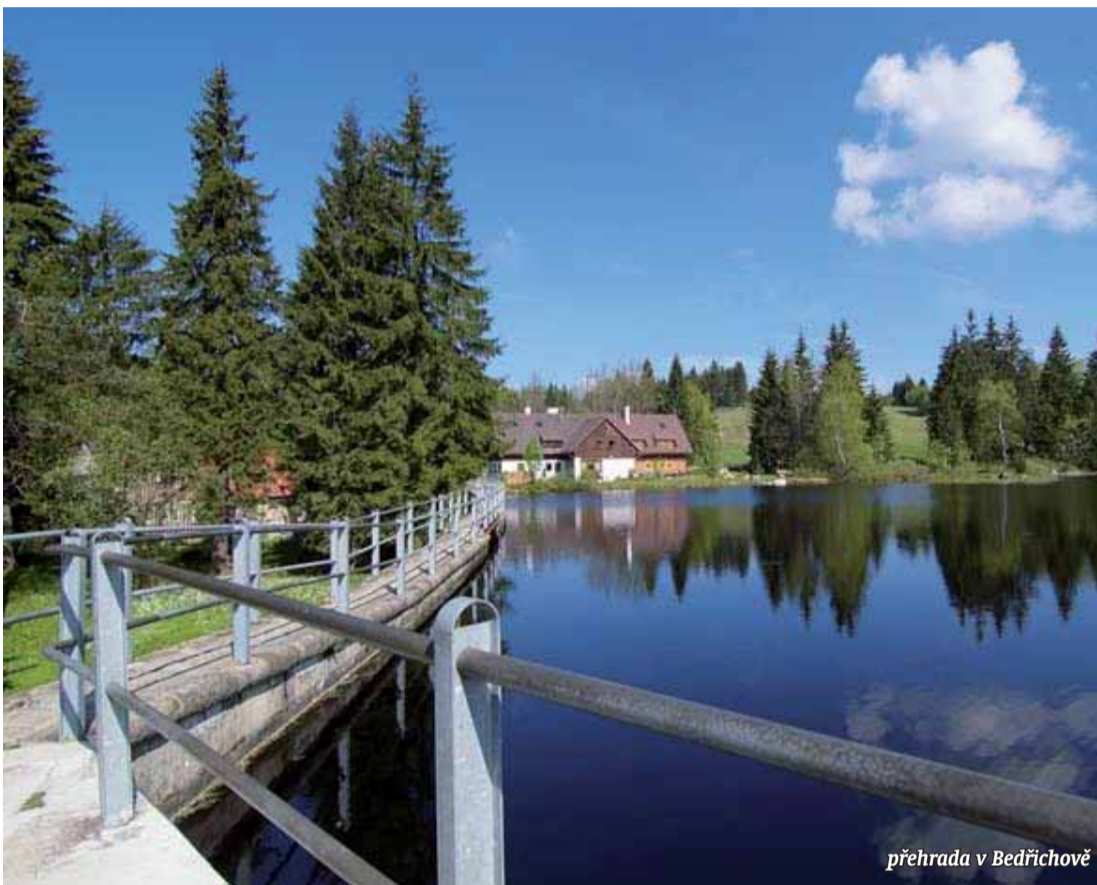
přehrada v Bedřichově

Vodní nádrž Fojtka, někdy nazývána Fojtecká nebo Mníšecká přehrada, leží na stejnojmenném potoce v obci Mníšek, 6 kilometrů severovýchodně od centra Liberce. Postavená byla v letech 1904 až 1906 podle projektu Otto Intze, který projektoval všechny přehrady v povodí Lužické Nisy. Zděná hráz je 11 metrů vysoká a 146 metrů dlouhá. Nádrž má rozlohu 7 hektarů a průměrnou hloubku 10 metrů. Voda v přehradě je poněkud chladnější, ale velmi čistá. Na pravém břehu je restaurace, na levém pak nudistická lokalita. (zdroj: wikipedia )