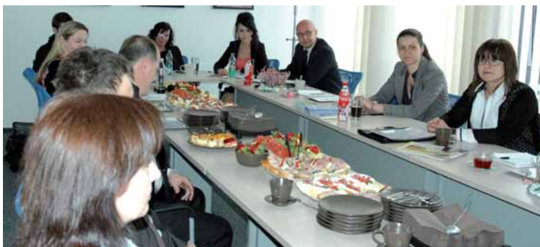
Starostové městských obvodů a spolupracovníci fondu.

Podrobnější informace o činnosti Nadačního fondu Evy Matějkové najdete na www.nfem.cz