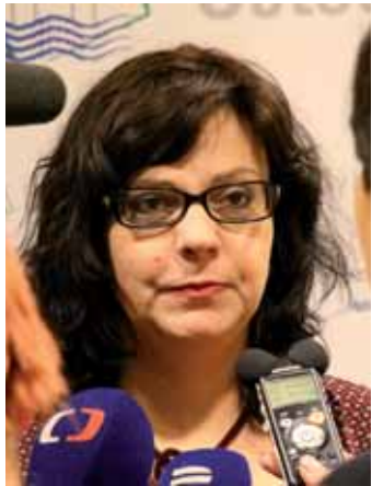
Ministryně práce a sociálních věcí ČR paní Michaela Marksová v zajetí novinářů na ústeckém hejtmánství.