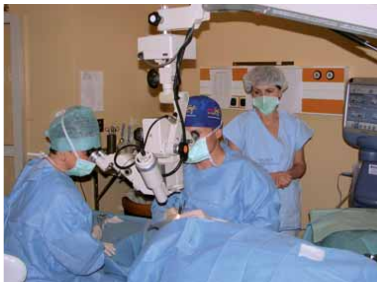
Tým očního oddělení liberecké nemocnice při mikrooperaci šedého zákalu.

Liberec | Oční oddělení Krajské nemocnice Liberec, a. s., zahájilo letos v červenci, po vzoru již mnohých pracovišť v ČR, novou metodu léčby chorob sítnice, a to nitroočním podáváním látky Avastin.