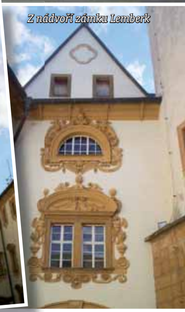
Z nádvoří zámku Lemberk