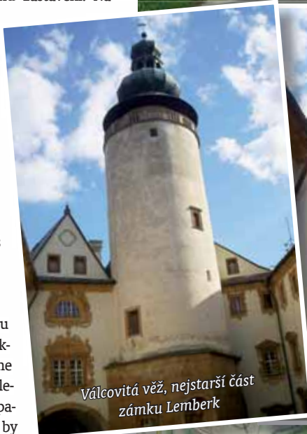
Válcovitá věž, nejstarší část zámku Lemberk