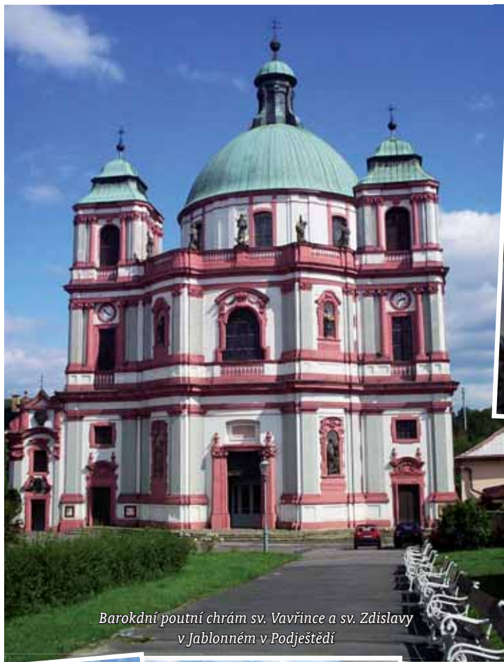
Barokní poutní chrám sv. Vavřince a sv. Zdislavy v Jablonném v Podještědí

Jsmo blíž k zámku a cesta se ubírá pěkně do kopce. Projdeme krásnou lipovou alejí, jejíž koruny jistě pamatují mnohé. Kéž by mohly vyprávět... Pár set metrů před Lemberkem, pod mohutnými stromy, stojí Letohrádek Bre-