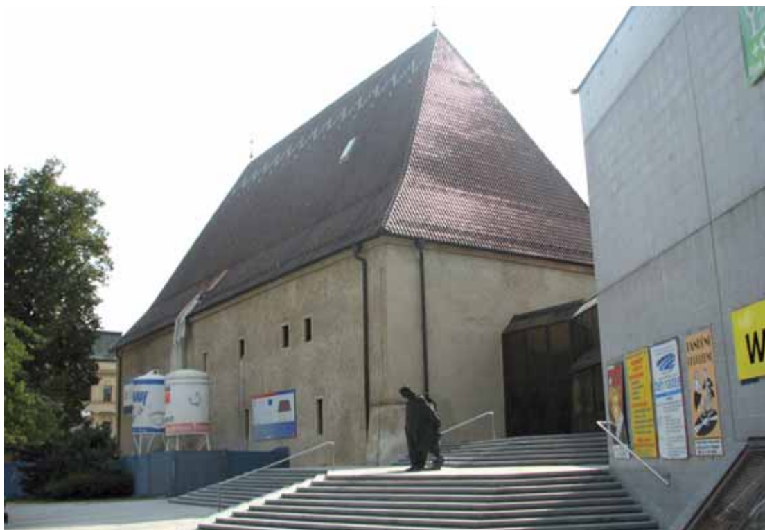
Svatostánek českého vinařství

Litoměřice | Jednou z dominant města je bývalý královský hrad, který patrně vznikl již ve 2. polovině 13. století, za Přemysla Otakara II. Přestavěn byl na začátku vlády Karla IV. a začleněn do nového pásu hradeb.