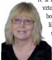
Sestavila: Ludmila Petříková

Panna 24. 8. - 23. 9. Neunáhlujte se, pokud chcete právě opustit partnera nebo partnerku. Dobře si rozmyslete, zda nový vztah, který je výsledkem bouřlivého léta, je natolik perspektivní, abyste se kvůli němu vzdali zájemů a jistoty.