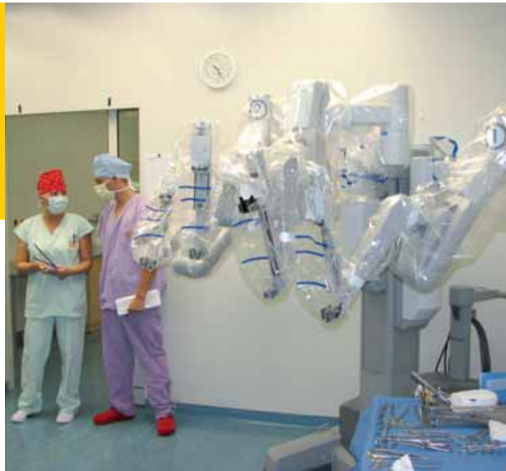
Jeden ze dvou robotických systémů daVinci SHD, kterými disponuje Centrum robotické chirurgie Krajské zdravotní, a. s., Masarykova nemocnice v Ústí nad Labem.

Ústí nad Labem | V nově založeném centru robotické chirurgie provozuje Krajská zdravotní, a. s., dva roboty daVinci SHD. Provoz systému, umožňujícího provádění chirurgických zákroků na člověku, byl zahájen před rokem. Kromě jiných oborů bylo operování robotem zavedeno také na ORL oddělení a oddělení chirurgie hlavy a krku.