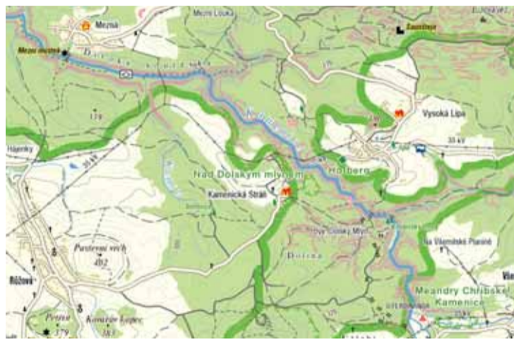
Mapka obsahuje místa, na která zavítáte během doporučeného pěšího výletu.

Pěší pochod zahájíme v Mezné, odkud se vydáme na jih po zelené ve směru k říčce Kamenici. Po přechodu můstku řičky Kamenice u tzv. Mezního můstku zahne vlevo a postupujeme podél řeky po žluté ve směru na Divokou soutěsku. U Mezního můstku musíme zaplatit vstup 20 Kč na dospělou osobu za užívání chodníků.