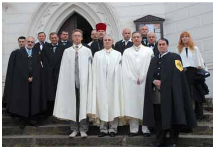
Stávající i nově pasovaní rytíři před Chrámem Povýšení sv. Kříže v Teplících.

ní děti bez rodičů. To mě osobně velice trápí. My tu jednou nebudeme a co se stane s dětmi, které vyrostou jako vlci na ulici? Osobně to vnímám jako největší bolest a chci se proto zasloužit o řešení tohoto v Rusku opravdu velkého problému.“