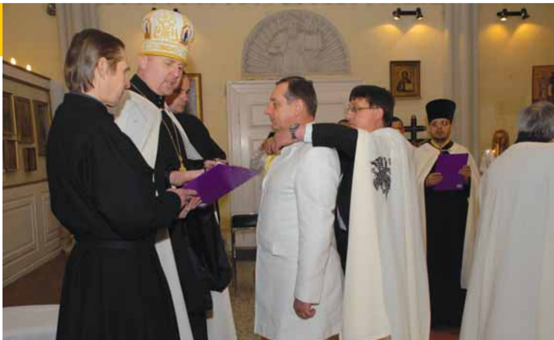
V Chrámu Povýšení sv. Kříže v Teplících byl 23. května pasován na rytíře generálporučík Vladimír Varennikov.

Na otázku, jaké dobré skutky hodlá činit on sám, odpověděl: „Svůj největší úkol vidím v tom postarat se o bezprizor-