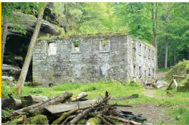
Dolský mlýn proslavila pohádka Pyšná princezna Bořivoje Zemana z roku 1952.

Trasa výletu: Mezná (zelená turistická značka) – Mezní můstek na říčce Kamenici (žlutá) – Divoká soutěska (žlutá) – křižovatka turistických cest Na strži (modrá) – odbočka na vyhlídku Ptačí kámen (modrá) – Vysoká Lípa (modrá) – Dolský mlýn (žlutá) – odbočka na Kamenickou vyhlídku (žlutá) – Kamenická Stráň (žlutá) – odbočka vpravo Pastevní vrch (naučná stezka - přerušovaná zelená) – Růžová