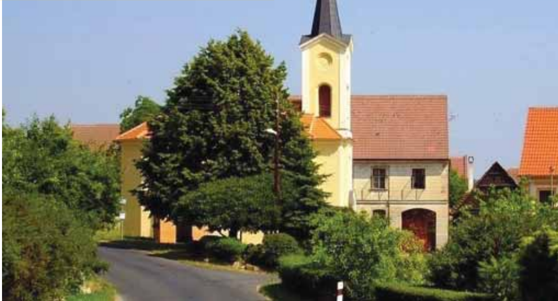
Ze svých prostředků postavili Staňkovičtí v roce 1711 malou kapli, která byla v roce 1724 zasvěcena Nanebevstoupení Panny Marie. Původně zchátralá kaple byla v roce 1867 zbořena a na jiném místě zakoupeném obcí byla v následujícím roce postavena kaple větší, opět nákladem obce (3000 zl.). Stavba s románskými prvky je dodnes významnou dominantou obce i okolní krajiny a k dokončení její rekonstrukce pomohou i peníze z Fondu hejtmána Ústeckého kraje.

tivá část peněz ve fondu pochází z darů od společnosti ČEZ a především Severočeských dolů. Podařilo se mi s jejich vedením dohodnout, že za to, že svou činností zatěžují životní prostředí a hlavně zdraví obyvatel, budou kraji pravidelně poskytovat peníze na jeho rozkvět. Díky tomu jsme mohli mezi žadatele z Fondu hejtmána vloni rozdělit 25 milionů korun a letos zatím zhruba 145.