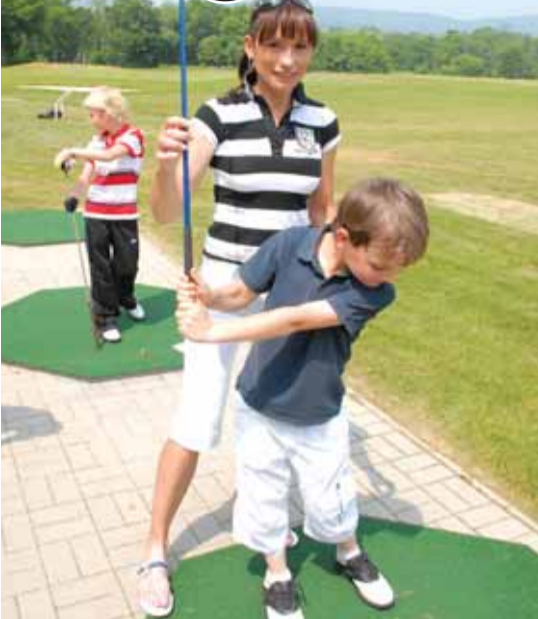
Do tajů golfu pronikají „na Barboře“ i malí hráči.