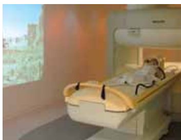
Na přístroji bude možné provádět vyšetřování:

Na našem pracovišti je i ojedinělá instalace osvětlení vyšetřovací místnosti. Nový přístroj přispěje ke zvýšení dostupnosti MR vyšetření dětem z celého Jihomoravského kraje.