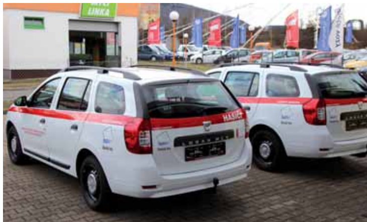
Alespoň dva ze sedmi nových krasaviců...

„Dobrovolné hasiče beru jako nedílnou součást integrovaného záchranného systému, tato vozidla jsou jen malým poděkováním za jejich obětavou práci. Naposledy jsme je v plné polní viděli například při povodních v roce 2013. Velmi mile mě i překvapil počet dobrovolných hasičů v celé republice, tedy