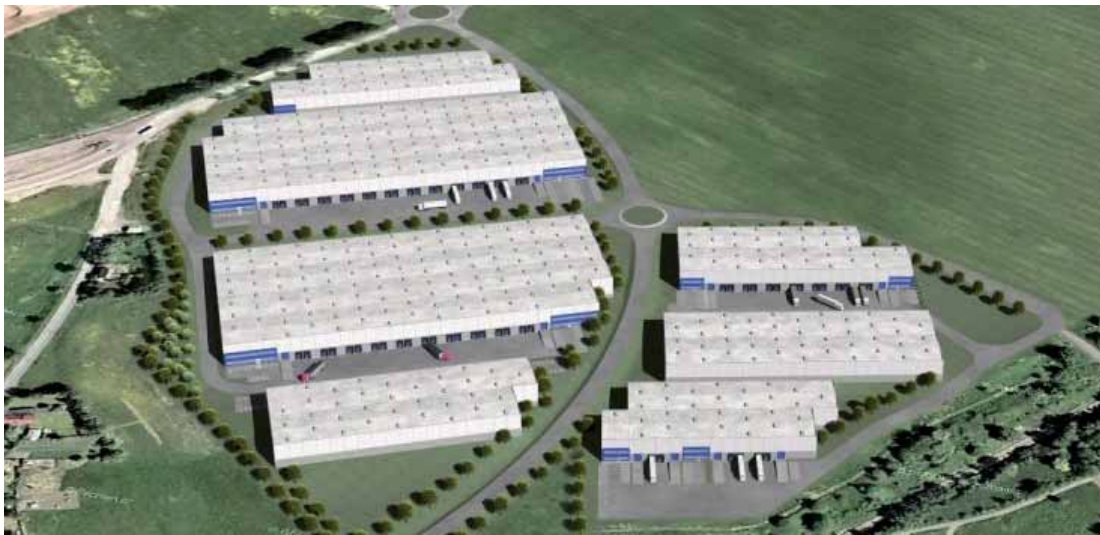
Vizualizace areálu CPI Park Žďárek nedaleko Libouchce.