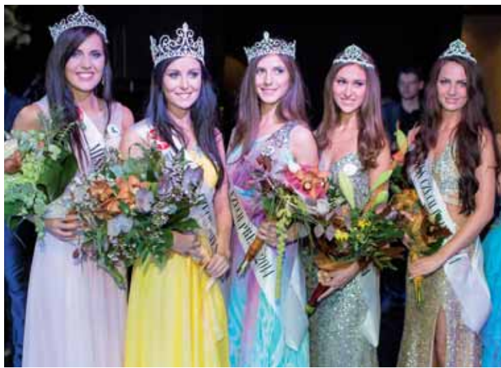
Veliká radost zavládla na závěrečném galavečeru prvního ročníku soutěže krásy Miss Czech Press v Praze. Moderátorem byl Karel Voříšek.

Text: Zuzana Vraštilová