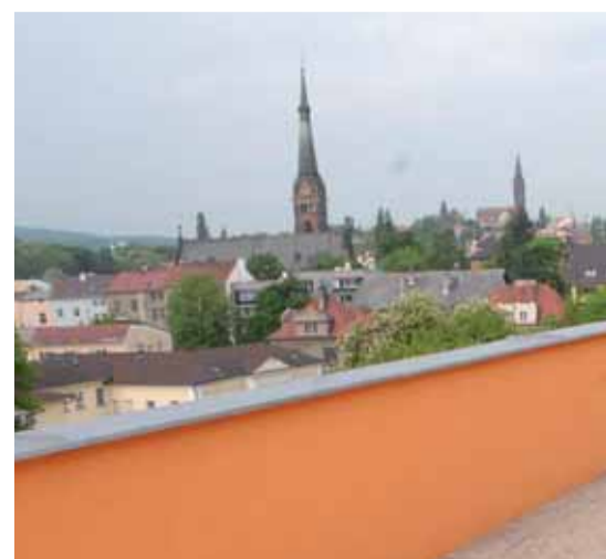
K výbavě apartmánu v pátém a šestém podlaží patří velké terasy. Z nich se otevírá krásný panoramatický pohled na Teplice a okolí.