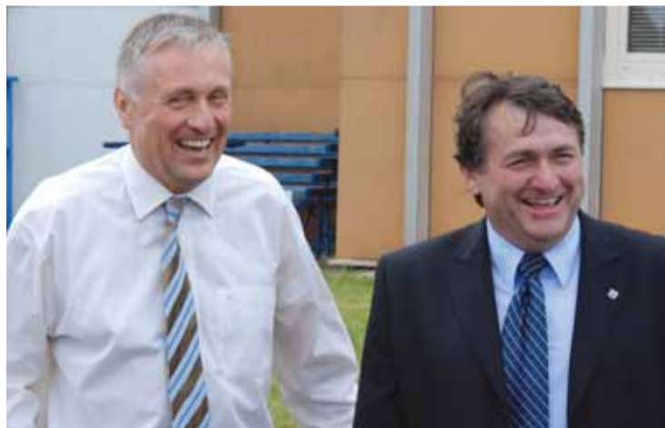
Premiér Mirek Topolánek a hejtman Jiří Šulc měli po letu dobrou náladu.

Text: zpravodajové Metropolu