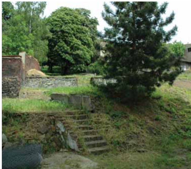
Stavební parcela je obklopena vzrostlou bohatou zelení.