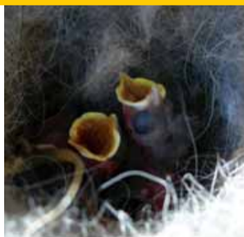
Projekt ptačích budek - kontrola hnízdění.

Na své si přijdou sběratelé suvenýrů, pro ně je připravena řada upomínkových předmětů s historickými motivy. Přípravuje se rovněž CD s hymna-