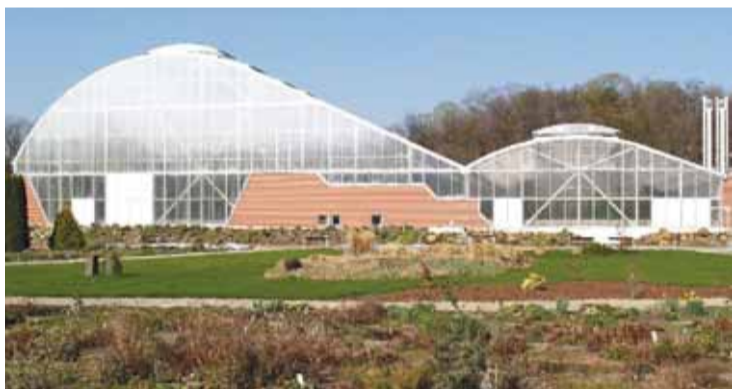
Skleníky v Botanické zahradě Teplice, která prošla v letech 2002 až 2007 rekonstrukcí.

Text: Eva Stieberová