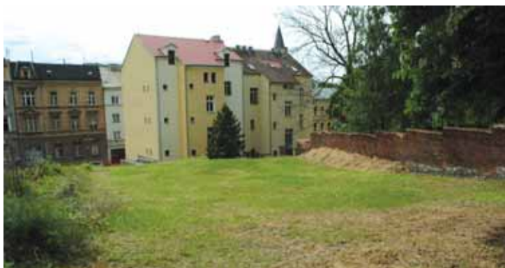
Pohled ze zadní části pozemku na Stroupežnického ulici.