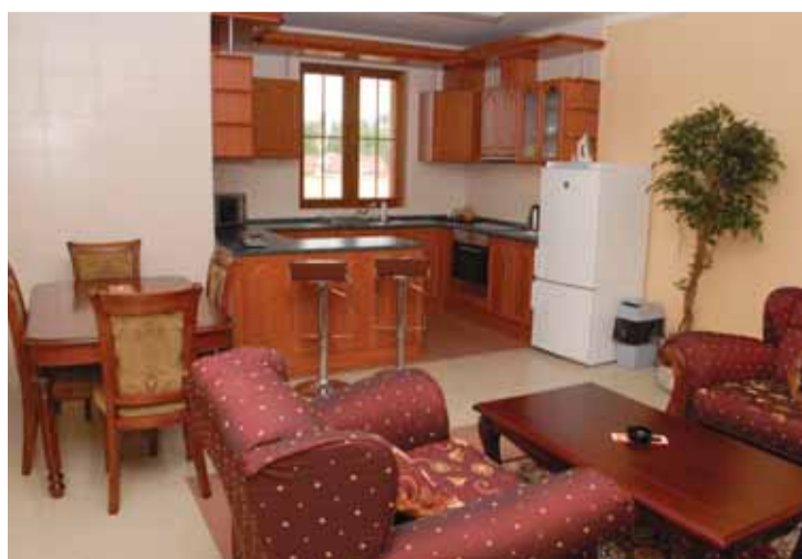
Hosté mohou ke stravování zvolit buď restauraci v přízemí bytového domu nebo si sami připravují jídlo v dokonale vybavené kuchyni, která je součástí prostorového obývacího pokoje každého apartmánu.