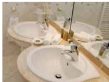
Koupelny nepostrádají luxusní výbavu.

rem a dvěma pokoji s kompletním sociálním zázemím a terasou. Z toho 4 apartmány mohou užívat tělesně postižení občané. V posledním, 6. nadzemním podlaží, jsou ještě dva nadstandardně vybavené apartmány pro VIP hosty. Střežené parkoviště pro hosty je vedle hotelu, o návštěvníky se stará 20 zaměstnanců.