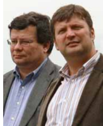
Místopředseda vlády pro evropské záležitosti Alexandr Vondra a ministr dopravy Aleš Řebíček při návštěvě Litoměřicka.

„Obě díla jsou jedinečnými stavbami, na jejichž dokončení čekají nejen motoristé a dopravci, ale především obyvatelé dotčených obcí, přes něž vedou současné velice přetížené trasy, proto ani jednu neupřednostňuji. Věřím, že se podaří překonat všechny překážky, které jim do cesty staví ekologové a nedojde k dalšímu zpoždění staveb,“ uvedl po prohlídce budoucího přemostění Oparenského údolí u Velemina ministr Řebíček. Všichni návštěvníci mohli na vlastní oči spatřit, jak citlivě stavbaři realizují náročnou akci, aby dodrželi veškeré požadavky, které pro tuto část dálnice stanovila Správa CHKO České středohoří.