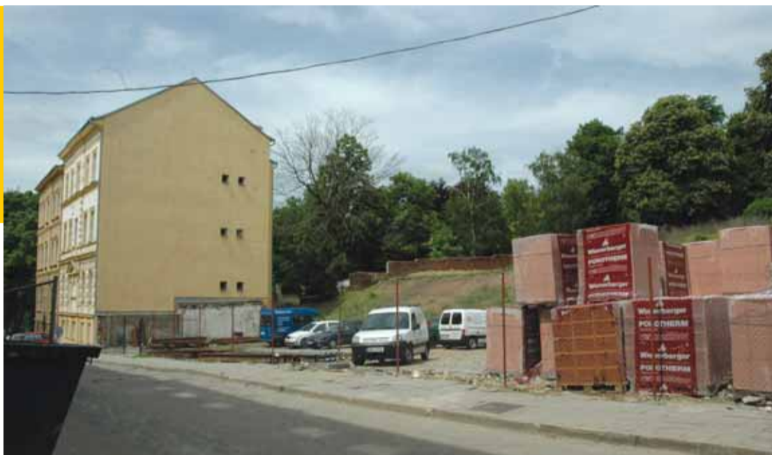
V místě, kde je v současné době pronajaté staveniště, bude stát nový objekt.

nikúrou – zkrátka tím základním, co seniory potřebují ke kvalitnímu každodennímu životu. K tomu patří také pobyt na čerstvém vzduchu. Za výše zmíněnými objekty a parcelou, která je v současné době pronajata jako staveniště, máme k dispozici výměru celkem 1 500 čtverečních metrů zeleně, včetně vzrostlých stromů, kde bychom vybudovali posezení. Druhou možností je výstavba hotelu. Vzhledem k tomu,