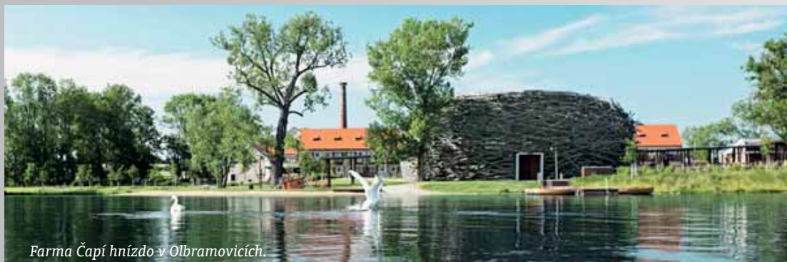
Farma Čapí hnízdo v Olbramovicích.