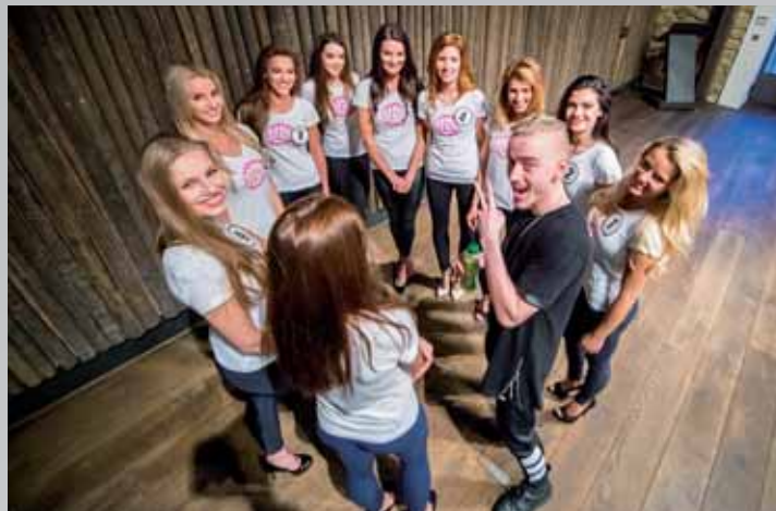
Všechny finalistky si soustředění v prostředí krásné farmy užívaly.