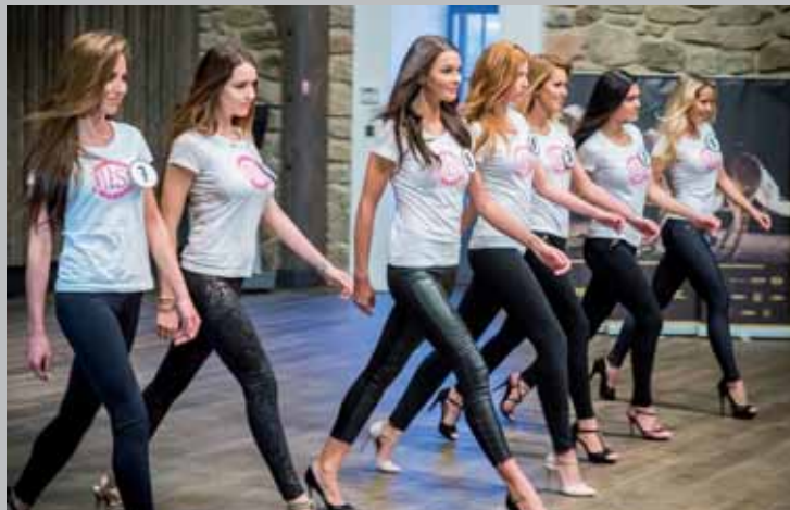
Nácvik chůze na slavnostní galavečer.