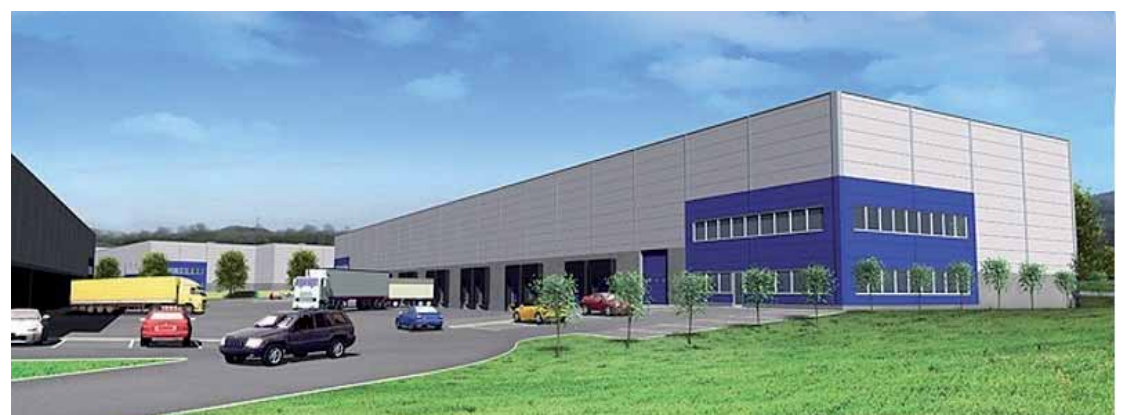
Vizualizace areálu Park Žďárek nedaleko Libouchce.