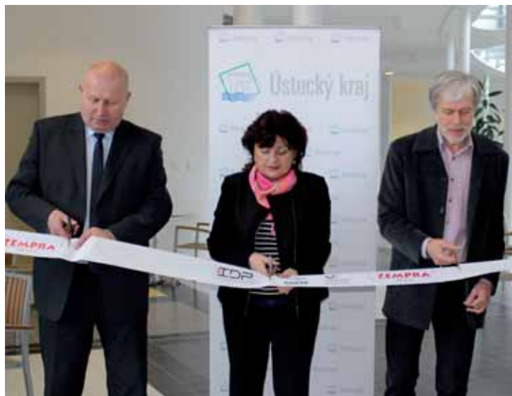
Zleva jsou při slavnostním aktu stříhání pásky hejtmán Oldřich Bubeníček, jeho náměstkyně pro školství Jana Vaňhová a ředitel gymnázia Alfréd Dytrt.

„Vznikl moderní gymnaziální komplex. To je výhra jak studentů, tak nás a samozřejmě zřizovatele,“ řek-