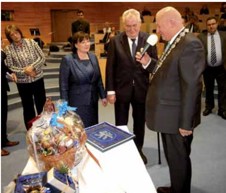
Návštěvu kraje zahájil prezidentský pár v pondělí 2. února na hejtmánství. V průběhu setkání se zastupiteli a nedávno nově zvolenými starosty si prezident a hejtmán navzájem předali drobné dárky.

Prezident během tří dnů navštívil Ústí nad Labem, Dubí, Teplice, Varnsdorf, Krásnou Lípou, Děčín, Most-Komořany a Jirkov. Ve všech těchto místech besedoval i s občany, představiteli nejvýznamnějších podniků, poslanci a senátoři, starosty a primátory, krajskými zastupiteli nebo s řediteli krajských či městských příspěvkových organizací. Byl například mezi pracujícími TOS Varnsdorf, dubského Českého porcelánu, Lázní Teplice nebo horníky Severní energetické. Oficiálně byl Miloš Zeman přivítán v pondělí 2. února před ústeckým hejtmánstvím, s krajem se rozloučil na zámku Červený Hrádek ve středu