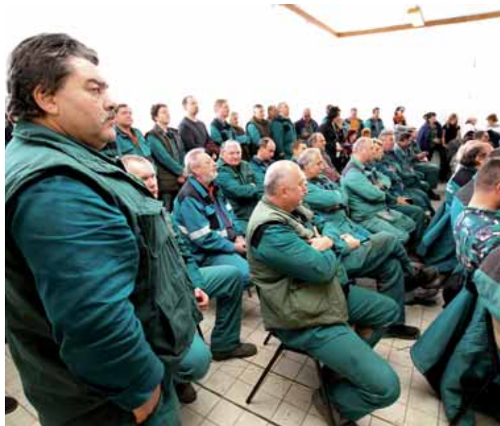
Mezi horníky z lomu ČSA, jenž patří Severní energetické, a. s., byl o setkání s prezidentem opravdu velký zájem. Rádi slyšeli, že i Miloš Zeman má s nimi shodný názor na potřebu prolomení limitů těžby.

Kromě společného přijetí na Krajském úřadu Ústeckého kraje měla prezidentova choť Ivana v doprovodu manžel-