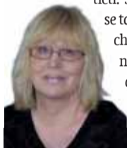
Sestavila: Ludmila Petříková