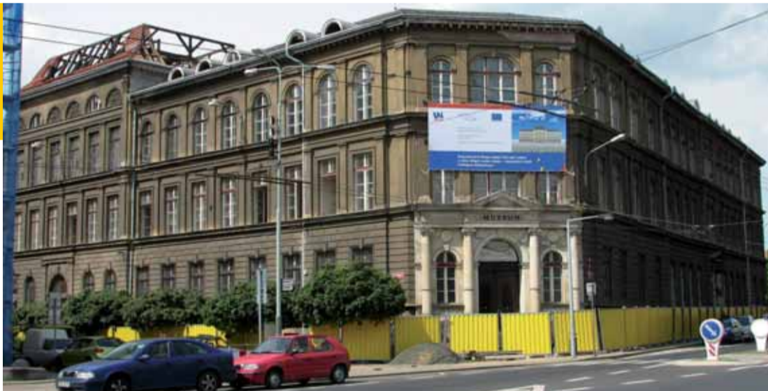
Uvnitř objektu ústeckého muzea i na jeho střeše se přes letní měsíce intenzivně pracuje.

V těchto dnech na stavbě proběhly nebo pokračují zemní práce, bourání příček, příprava pro zámečnické