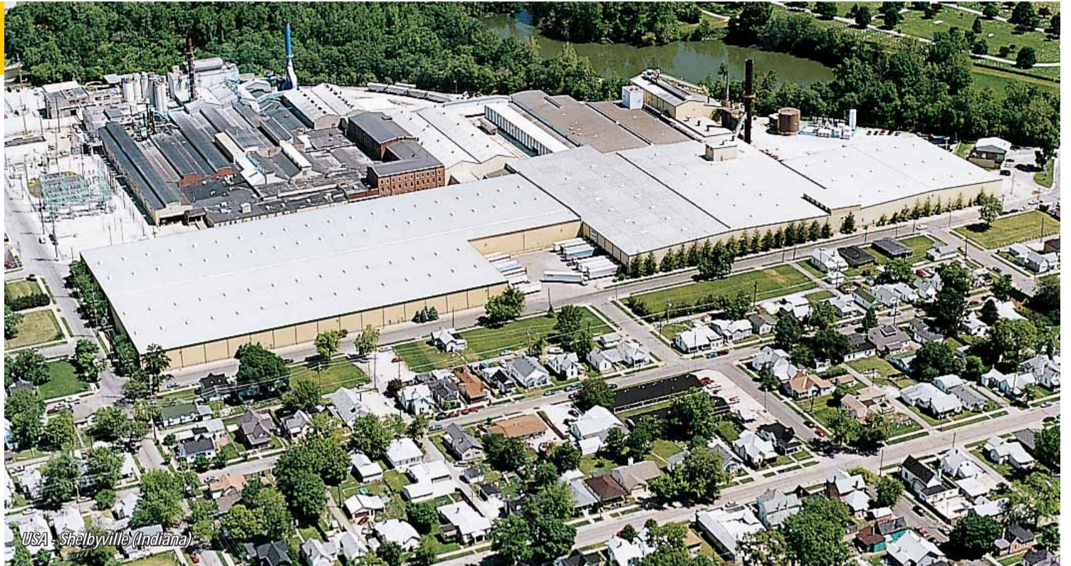
USA - Shelbyville (Indiana)

Za tímto rozhodnutím generálního ředitele skupiny Tonyho Robsona, kterému budeme v září skládat konečný účet naší práce, stojí um a zkušenosti našich lidí, výsledky naší práce v Krupce. Nové závody KI v Evropě, k nimž ten náš patří (vyrábět začal v roce 2006 – pozn. redakce), jsou oproti Americe dynamičtější a dravější, mají větší chuť se o úspěchy poprat. Netrpí tolik takzvanou provozní sletou a vyjetými koleji. Proto mají lepší výsledky, jsou nákladově efektivnější, což ovšem neznamená, že není co zlepšovat. Američané jsou naproti tomu o něco dál díky novému modelu řízení a přístupu k vnitřní problematice závodů. Na druhé straně americký průmysl dusí neupravné kolektivní smlouvy s odbory a drahá pracovní síla, umocněná výraznými náklady na systém zdravotního pojištění.