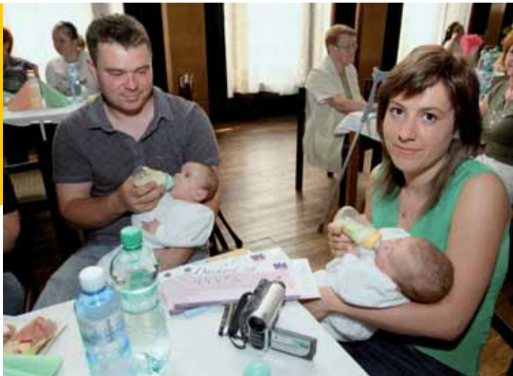
Dvojnásobné štěstí znamená i dva šeky a dva památníčky pro prvorozené.

Jako pokaždé se v hodinovém programu, který tentokrát sledovalo 62 maminek s doprovodem, většinou tatinků a prarodičů, vystřídaly zdravotní představitelky města, videoprojekce o Ústí nad Labem, vystoupení dětského pěveckého sboru Kořata a zápis maminek a prvorozených dětí do registrační