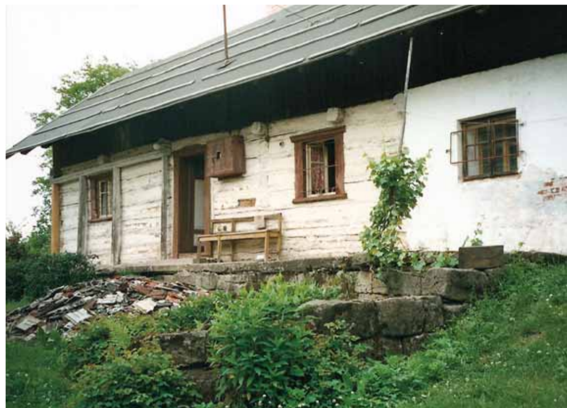
V době, kdy jsme slavnou filmovou chaloupku v Českém ráji vypátrali, se její majitelé chystali opravit střechu.

Dalo dost práce - příjemně, zkoumat, kde se která scéna natáčela. Při příští návštěvě Českého ráje máme v plánu přejít kamenný můstek v Podsemíně, přes který jezdili Vašek a Luboš na nákupy. Kráček - Smišené zboží - se nachází ve Vesci (památkové rezervaci lidové architektury nedaleko Sobotky proslavené spisovatelem, básníkem a dramatikem Fráňou Šrámkem), stejně i poštovní schránka, do níž chtěla Anna vhodit dopis adresovaný matce. Neučinila tak, protože posádka Máni (jednou „chcípala“, podruhé „našla zastavit“...), která měla krátký žebřík a tudíž nemohla zachránit Luboše načapaneho na Dračím zubu, Annu informovala o Lubošově odjezdu. „Vodníková studna“ je u filmové chaloupky, jejíž součástí je stodola, odkud Anna zběsile vyrazila na kole za Lubošem, jenž visel na skále. Studna, pod kterou unesl děda Vaška, jenž v ledové vodě složil zkoušku odvahy a stal se „pašákem“, byla fiktivní. Postavili ji tam filmaři pro natáčení, tlak vody obstarávalo skryté čerpadlo.