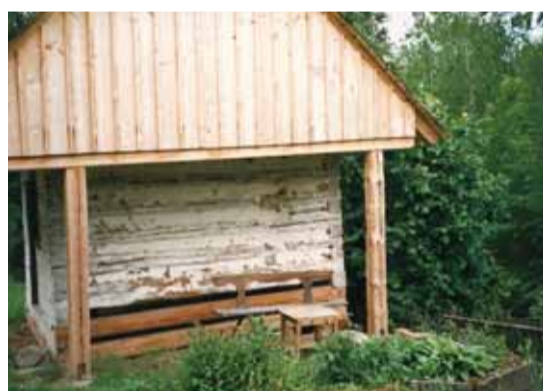
Studna, ze které chtěl vystrašit děda ve vodnickém převleku vnuka. Na druhém snímku je místo, kde filmové rodince chutnal chléb posypaný pažitkou. Zde také děda vyzýval, proč Luboš pořád běhá za Vaškovo mámou...