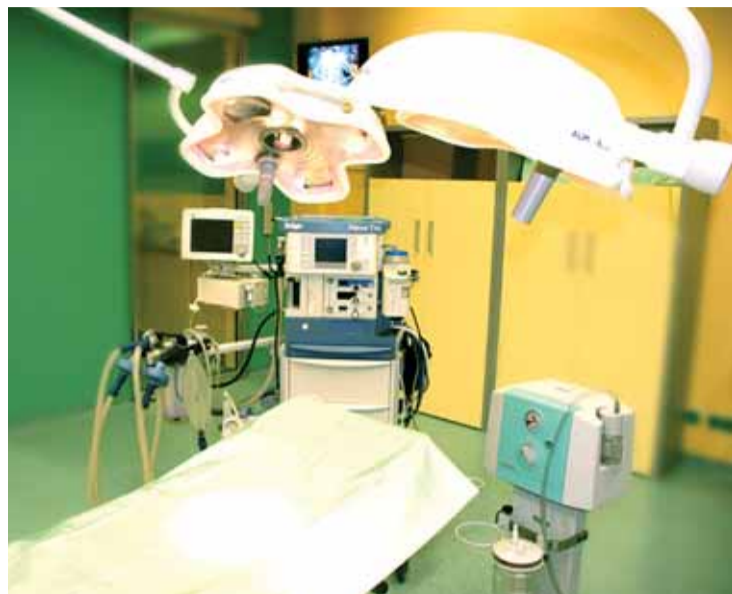
Pohled na jeden ze čtyř klimatizovaných operačních sálů.

Říkám to s klidným svědomím. Máme k dispozici čtyři klimatizované opera-