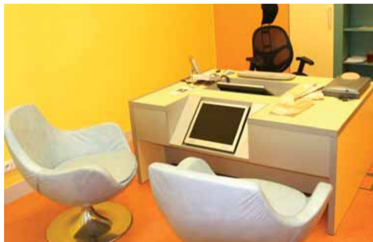
Konzultační místnost. Na obrazovce vidí klient, jak bude vypadat po zákroku.