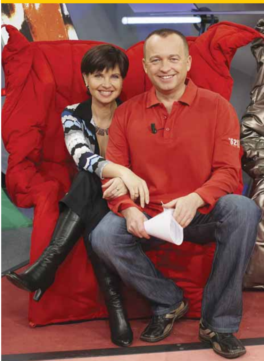
Markéta Fialová a Karel Voříšek jsou na televizní obrazovce nerozlučný a také velmi sympatický pár.

Televizní noviny na Nově spolu moderují už tři roky. V dobrém i ve zlém. Před dvěma lety přečkali Markétinu nemoc a letos oslavili Karlovo vítězství v anketě divácké popularity TýTý. Markéta Fialová a Karel Voříšek jsou jednou z nejsympatičtějších televizních dvojic.