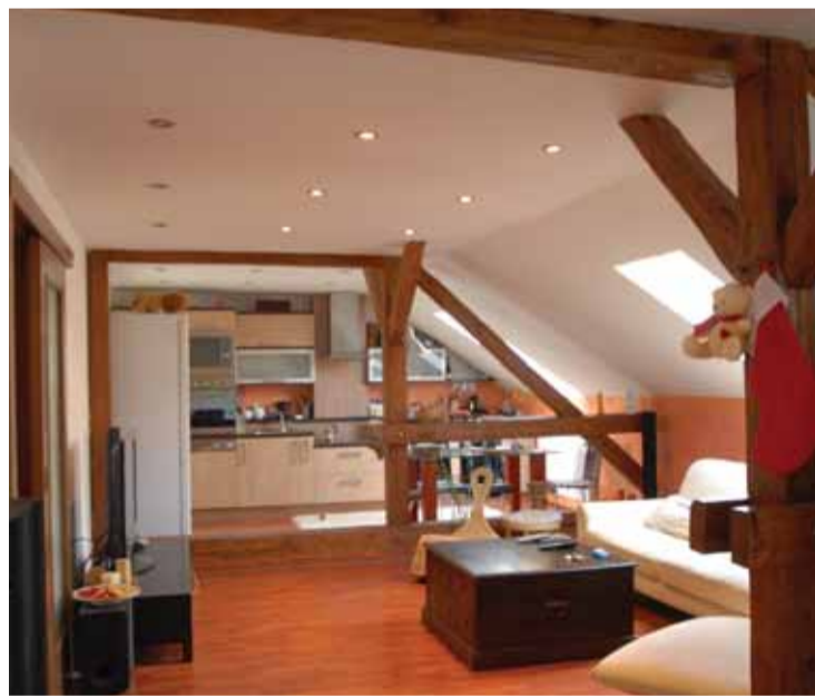
Takto vypadají obývací prostory zrekonstruovaného podkrovního bytu.