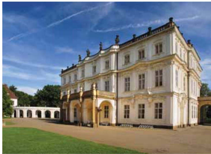
Ploskovic zámek na Litoměřicku patří k nejkrásnějším zámkům v Čechách.