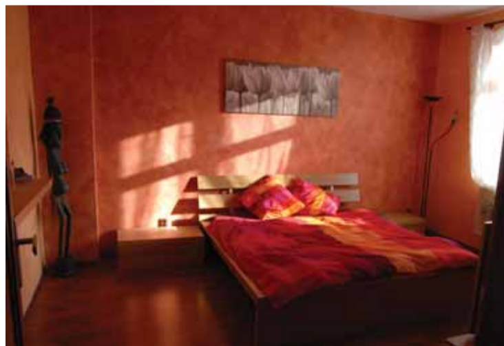
Místnost na spaní je barevně sladěná do hnědých a okrových tónů.