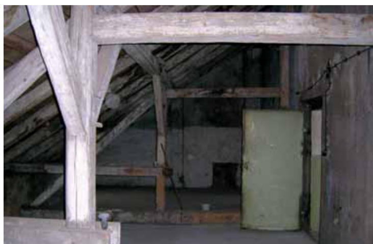
Původní půda činžovního domu v ústeckém centru...

O podkroví snil ve svém tehdejší panelovém bytě se 37 metry čtverečními na ústeckém sídlišti Lubomír Machoň, šéf agentury Dream Production. Dnes se může radovat: Proměnil sen ve skutečnost.