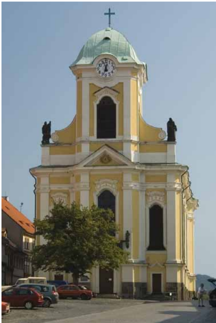
Kostel sv. Petra a Pavla na Mírovém náměstí v Úštěku znáte z filmu Rebelové.

Úštěk je městskou památkovou rezervací s řadou vzácných staveb. Dominantou města je pozdně barokní kostel sv. Petra a Pavla a tzv.