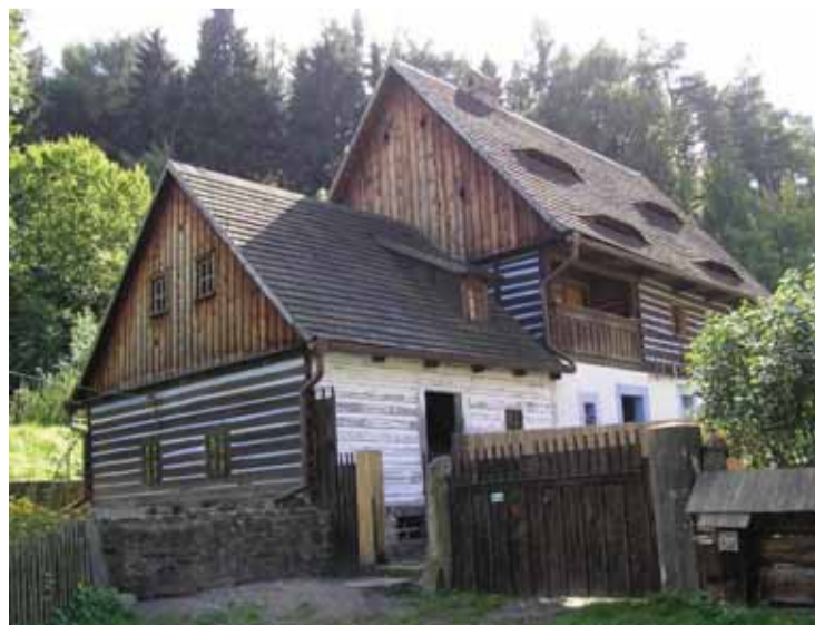
Mlýn v Muzeu lidové architektury v Zubrnicih nedaleko Ústí nad Labem.