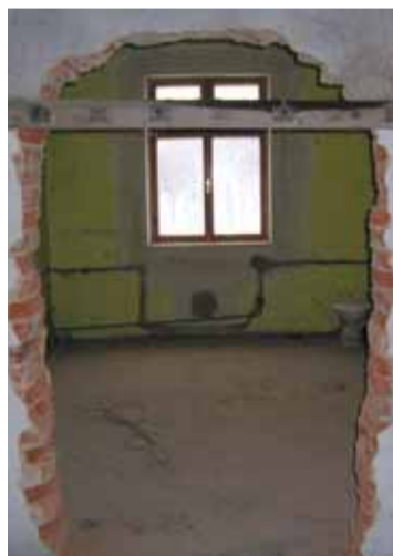
Z bývalé koupelny je ložnice.