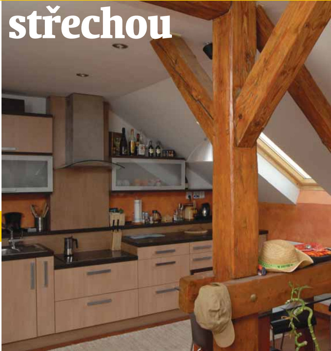
... se proměnila k nepoznání. Na kuchyňskou linku vyrobenou na zakázku je majitel bytu pyšný.

Dvacet metrů čtverečních patří koupelně, s níž má majitel ještě další plány. Rohovou vanu, sprchový kout s masáž-