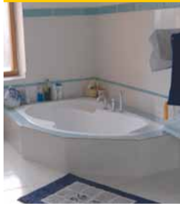
Modrozelené prvky koupelny, kde dominuje bílá, příjemně doplňují.

O podkroví snil ve svém tehdejší panelovém bytě se 37 metry čtverečními na ústeckém sídlišti Lubomír Machoň, šéf agentury Dream Production. Dnes se může radovat: Proměnil sen ve skutečnost.