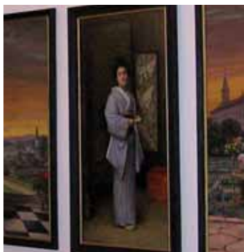
Horšovskotýnský zámek připomíná pobyt paní Mitsuko.