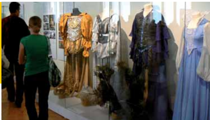
Nádherné jsou i kostýmy Slunečníka, Měsíčníka a Větrníka z pohádky Princ a Večernice.

Nádherné Popelčiny šaty, které vyloupila ze tří oříšků, myši kožíšek nebo šaty ušité na přání princezny se zlatou hvězdou, či oděv šilene smutné princezny a celou řadu dalších lze už do konce prázdnin vidět v hlavní budově Západočeského muzea. Neboť právě sem dorazila na své pouti půvabná výstava Jak se oblékají pohádky.