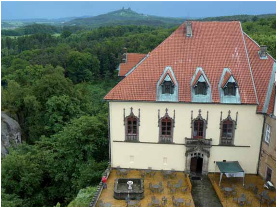
Odměnou po vystoupení na zámeckou vyhlídku je pohled na krajinu Českého ráje. Věvodí jí zřícenina Trosky.

Z oblasti Hruboskalska vyčnívají pískovcové skály. Mezi nimi našel skrýš princ Bajaja, který si zahrál na němeho, aby si vybojoval srdce Slavěny. Adamovo lože je jen kousek od zámku. Poblíž se také nachází hrad Valdštejn, jehož okolí je v pohádce spojené s hororovými scénami, a to se souborem s drakem.