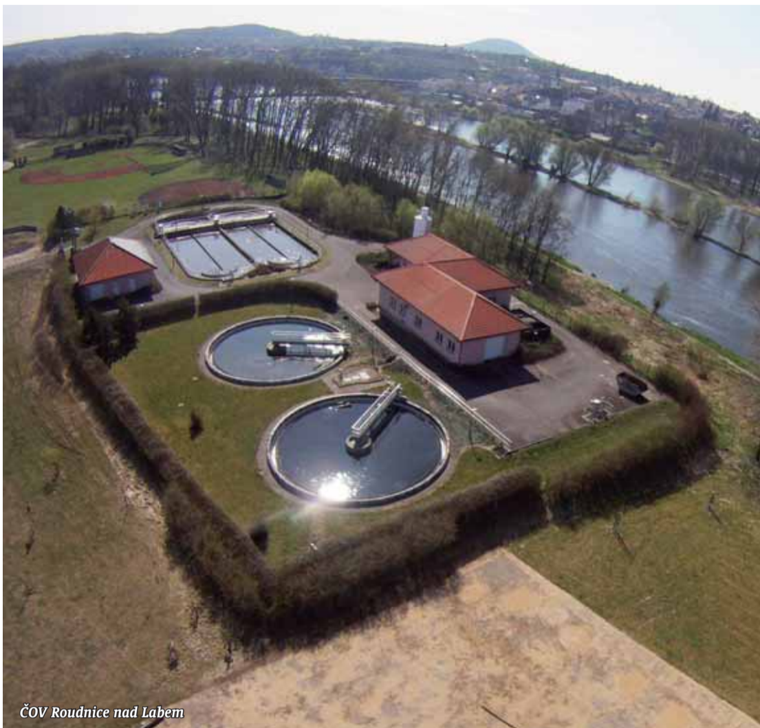
ČOV Roudnice nad Labem

V soutěžních podkladech jsme dále uvedli, jak v rámci realizace jednotlivých opatření využíváme nejmodernější technologie, pozornost věnujeme také implementaci inovativních postupů a využití obnovitelných zdrojů energie. Jednou z těch-