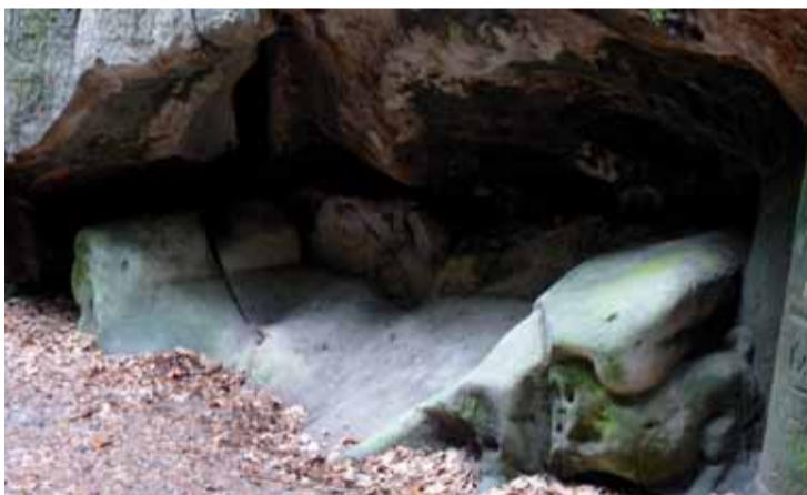
Ze zámku Hrubá Skála vede turistická stezka k Adamovu loži. Tam přespával princ Bajaja a rozmlouval se svým "rádcem" konikem, jehož zachránil před černým princem.