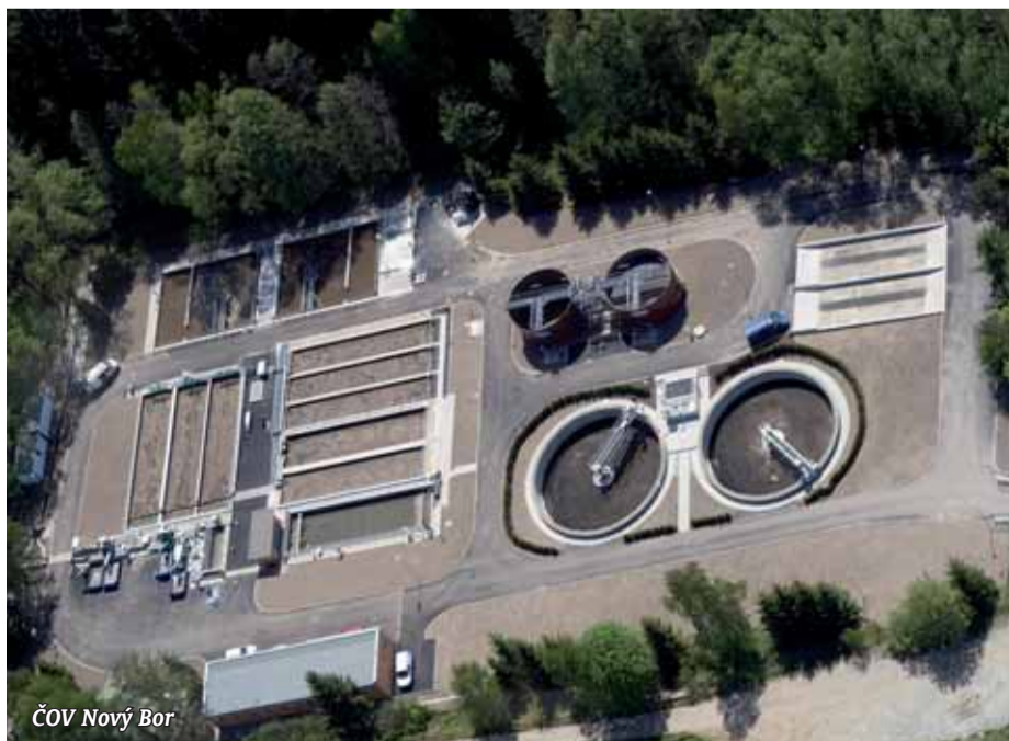
ČOV Nový Bor