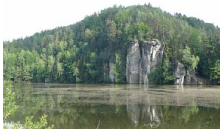
Na břehu Věžického rybníka nacházel princ Bajaja osvěžení. Rybník je známý například z komedie Jak dostat tatínka do polepšovny nebo Andělská tvář.

O kus dál se lze pokochat u snad neznámějšího rybníka v Českém ráji. Věžák proslavila komedie Marie Poledňákové Jak dostat tatínka do polepšovny. Břehy rybníka lemují skály, které filmový Vašek (Tomáš Holý) miloval a se svým tatínkem (František Němec) zdořoval.