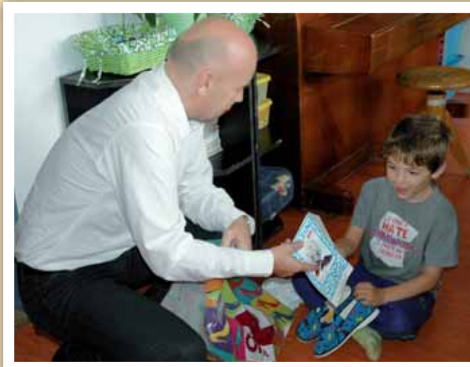
Malému Martinovi se líbily bačkorky a učaroval mu i ruksak.