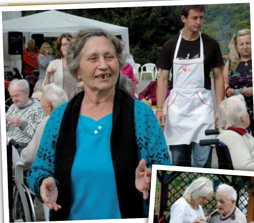
Panovala dobrá nálada, umocněná dobrým jídlem.