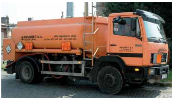
Speciálně upravené cisterny sváží použitý olej. Ročně ho sesbírají kolem tisíce tun.