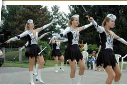
Klienty domova přišly pozdravit také mažoretky.