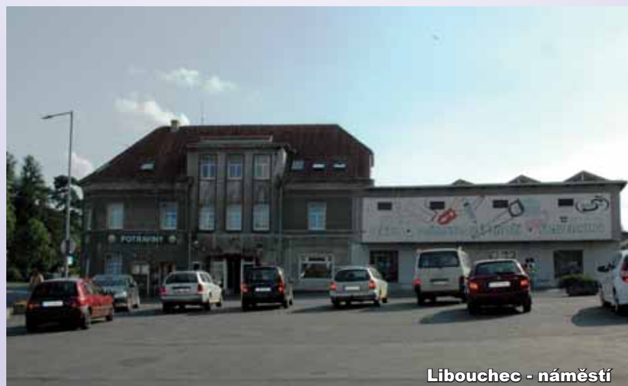
Libouchec - náměstí