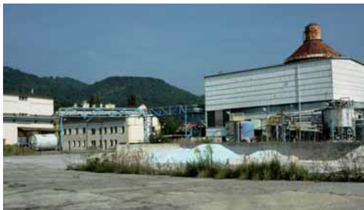
A tohle je pohled od stáčírny směrem k obytným domům.

ných domů. Firma usiluje o potřebné stavební povolení, o svém záměru informovala stavební úřad, odbor životního prostředí i vedení ÚMO Neštěmice a nikde se nesetkala s připomínkami či nevolí.