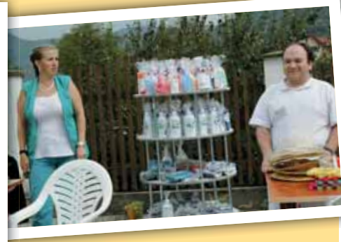
Bohatá tombola skrývala nejedno překvapení, ale samé užitečné věci.

Veselá nálada panovala ve čtvrtek 11. září v areálu Domova pro seniory ve Velkém Březně. Kona se tu totiž tradiční zahradní slavnost, kterou pro své klienty připravili zaměstnanci zařízení. Obyvatele přišli pozdravit také hosté, zastupitelé města a městských obvodů Ústí nad Labem.