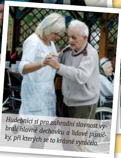
Hudebníci si pro zahradní slavnost vybrali hlavně dechovku a lidové písničky, při kterých se to krásně vytáčelo.