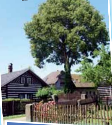
Architektura ve Veselí