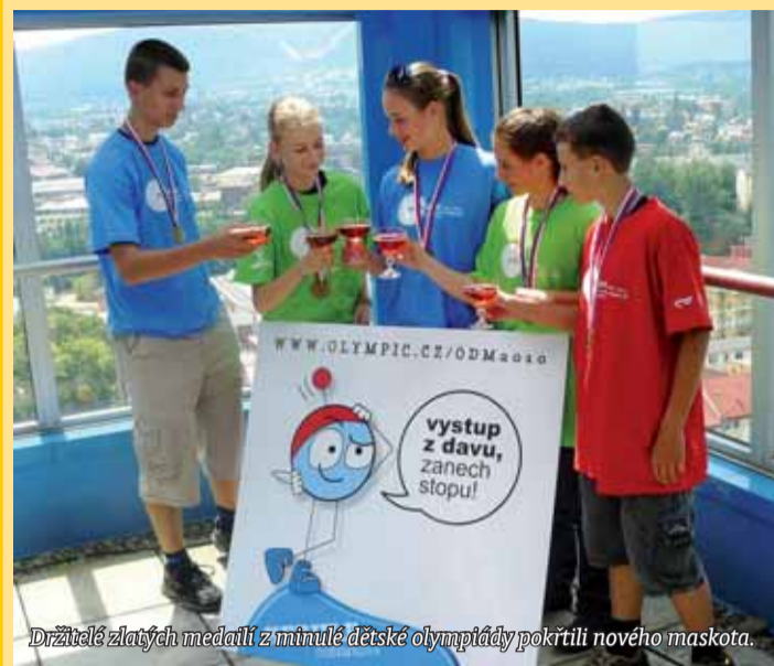
Držitelé zlatých medailí z minulé dětské olympiády pokřtili nového maskota.

Liberec | Mladí vítězové Olympiády dětí a mládeže (ODM) 2008 z Libereckého kraje slavnostně pokřtili maskota Her IV. zimní olympiády dětí a mládeže, které se v Libereckém kraji uskuteční od 31. ledna do 5. února 2010.