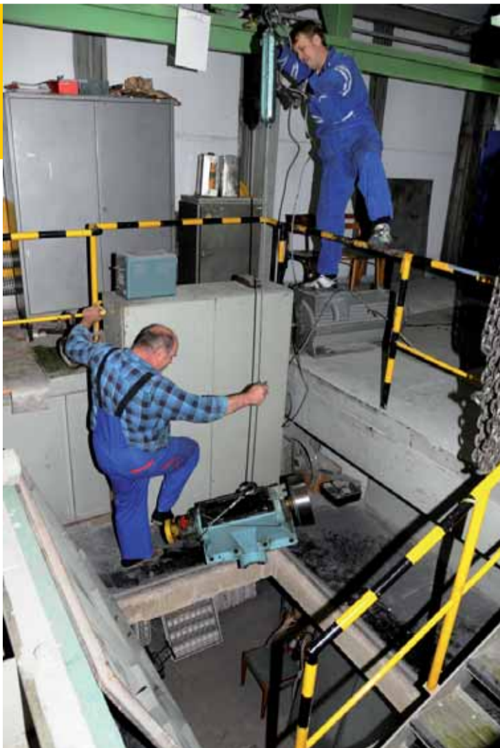
Páternoster se po pětadvaceti letech na čtyři dny v červnu zastavil kvůli údržbě.