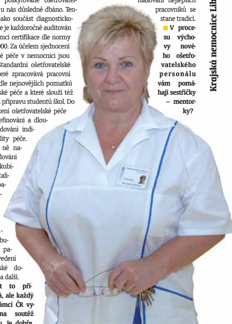
Krajská nemocnice Liberec

■ V procesu výchovy nového ošetrovatelského personálu vám pomáhají sestřičky – mentorky?