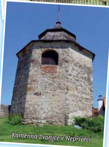
Kamenná zvonice v Nepřívěci