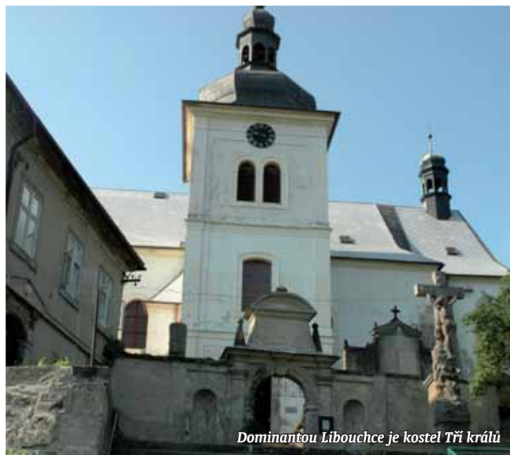
Dominantou Libouchce je kostel Tří králů

Co se najednou stalo, že přišla bouře nevole? Jménem obyvatel Libouchce se teď ohání kde kdo. Všichni se zaštiťují tím, že pro ně chtějí to nejlepší. Je tomu opravdu tak? Nebo hrají prim skupinové a osobní zájmy některých zastupitelů před bližšími se komunálními volbami? Myšlenka, že nové zastupitelstvo změní územní plán Libouchce a udělá tak CPI Parku Žďárek čáru přes rozpočet, má jedno velké úskalí. V případě, že se investor odvolá, půjde k soudu a bude chtít náhradu škody za již proinvestované prostředky, by prakticky znamenala likvidaci obce i jejích satelitů. Na místě je proto české přísloví: Dvakrát měř a jednou řež!