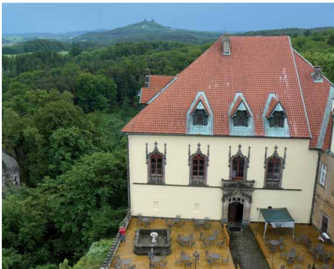
Odměnou po vystoupení na zámeckou vyhlídku je pohled na krajinu Českého ráje. Věvodí jí zřícenina Trosky.

Většinu filmové pohádky je sice němý, ale hlas mu propůjčil herec Petr Štěpánek, princ ze Zlatovlásky, která vznikla v roce 1973 na zhruba dvacet minut autem vzdáleném zámku Sychrov, někdejšího sídla francouzského rodu Rohanů. Na Sychrov lze zajet jednak na