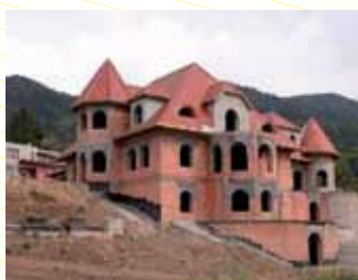
Rodinný dům Brně.