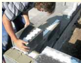
Výstavba rodinného domu.