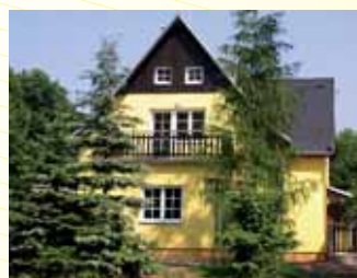
Rodinný dům - hájovna Velešín.