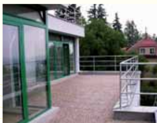
Rekonstrukce vily Praha.