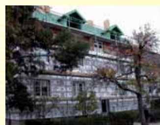
Podkrovní byty Praha.

NABÍDKA SLUŽEB PLATÍ JAK PRO VELKOODBĚRATELE, TAK PRO SOUKROMÉ STAVEBNÍKY