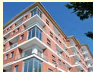
Bytový dům Ústí n. L.