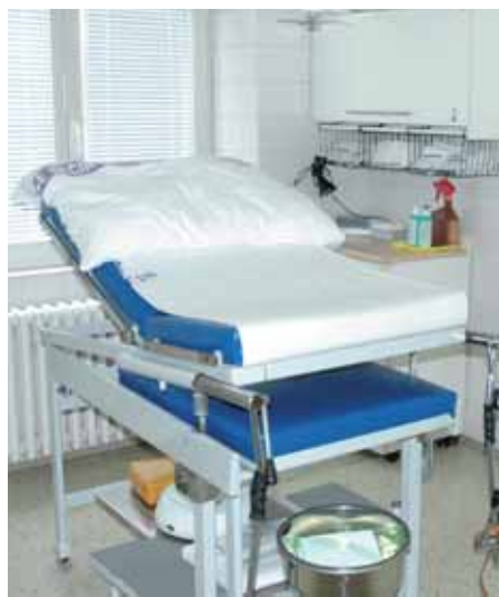
Složené porodní lůžko na sále je stále připravené.

Rád bych společně s kolegy realizoval v KZ pilotní projekt - mezioborovou spolupráci v oblasti operativy onemocnění prsou. Ta by měl, podle mého názoru, operovat chirurg-gynekolog s asistenční a konzultační činností s onkologem, patologem, případně s dalšími obory.