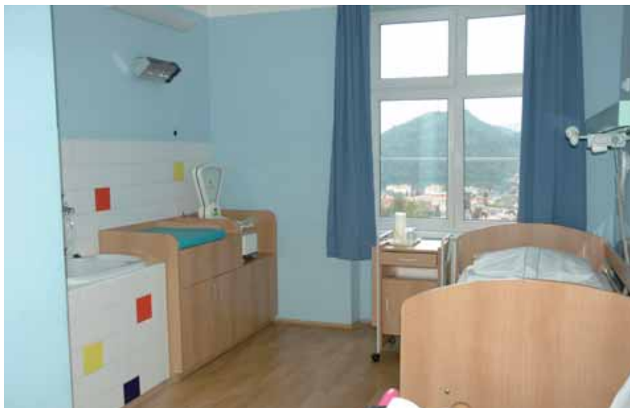
Na nadstandardním pokoji rodičkám a dětem nic nechybí.