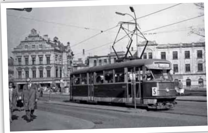
Rok 1971 s tramvají T2 č. 23, která se chystá k odjezdu ze stanice Rybníček v centru města do Horního Hanychova pod Ještěd. Vlevo za tramvají je pak původní obchodní dům stejného jména, jako dominanta nad Libercem.