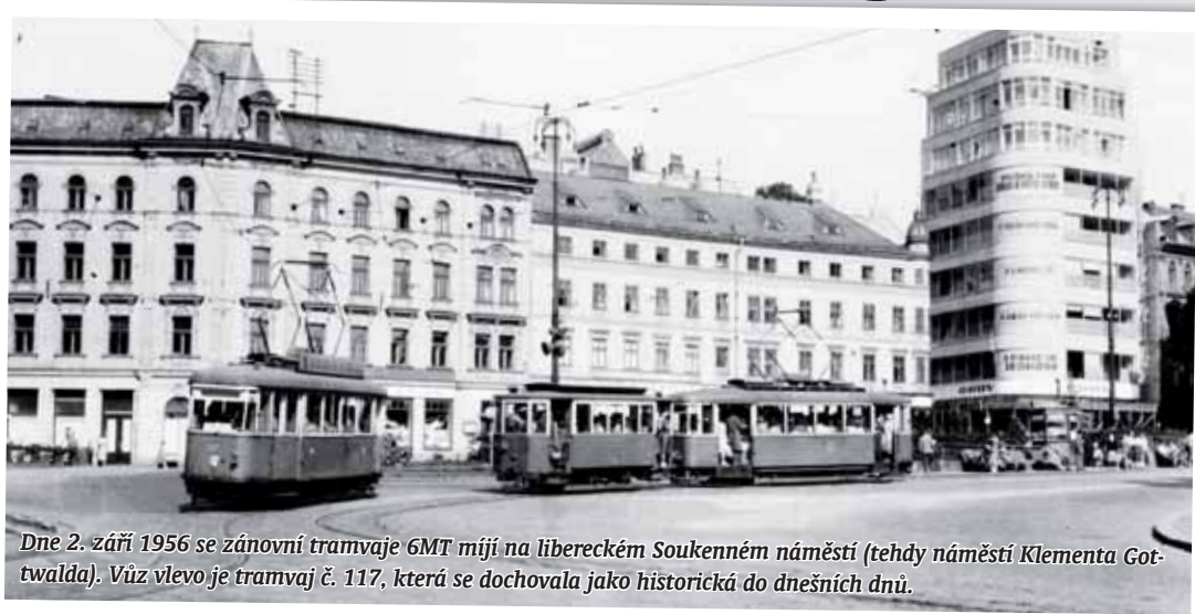
Dne 2. září 1956 se zánovní tramvaje 6MT míjí na libereckém Soukenném náměstí (tehdy náměstí Klementa Gottwaldy). Vůz vlevo je tramvaj č. 117, která se dochovala jako historická do dnešních dnů.