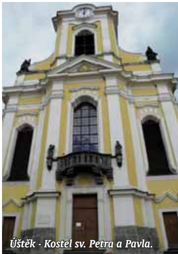
Úštěk - Kostel sv. Petra a Pavla.