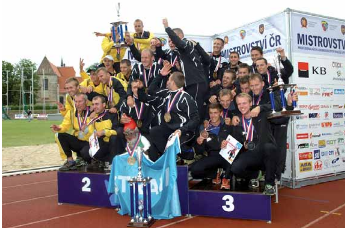
Zakončení hasičského mistrovství. Stupně vítězů v kategorii profesionálů.

„Nejde o medaile. Ocenění si zaslouží všichni hasiči, kteří často v tvrdých podmínkách ochraňují životy, zdraví a majetek nás všech. V každé kritické situaci, při požárech, dopravních nehodách, povodních, hromadných neštěstích, ať jsou jejich příčiny jakékoli, bývají vždy mezi prvními, kteří za nás čelí vzniklé hrozbě často s nasazením vlastního života a zdraví bez ohledu na to, zda jsou profesionálními či dobrovolnými hasiči,“ uvedl hejtman a poznamenal, že Jihočeský kraj si význam profesionálních i dobrovolných hasičských sborů pro bezpečí celého regionu dobře uvědomuje.