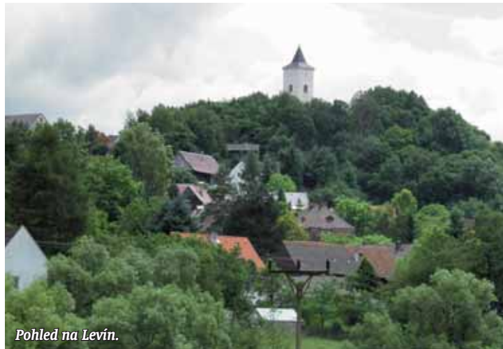
Pohled na Levín.

Úštěk, Levín, Zubnice. Místa známá z filmů. Turisté je vyhledávají i pro zajímavosti, které stojí za to vidět. Třeba letos v létě.