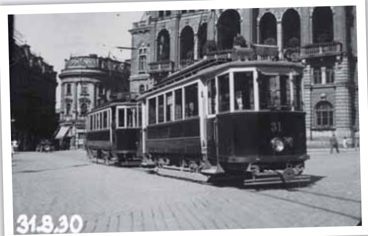
Dva motorové vozy na dnes již zrušené lince č. 2 do Růžodolu I. zachytil Erwin Cettineo před libereckou radnicí v poslední srpnový den roku 1930. Fotograf doplňoval snímky nejen přesnou datací, ale také údaji o použité cloně, času expozice a ostření.