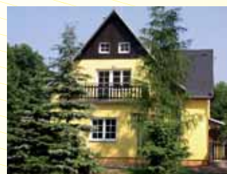
Rodinný dům - hájovna Velemín.