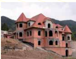
Rodinný dům Brná.