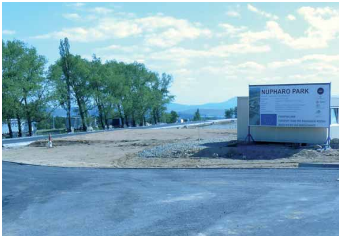
V blízkosti plochy, přesněji na opačné straně silnice, kde má stát Park CPI Žďárek, už se stavět začalo. Pro nezaměstnané v Ústeckém kraji je důležité, že naděje na získání dalších nových pracovních míst ve firmě Nupharo trvá i v případě Parku CPI Žďárek.

rody a krajiny České republiky, odborných posudků, výsledků monitoringu výskytu chráněných živočišných druhů, a řadu dalších odborných vyjádření včetně České společnosti entomologické a Správy chráněné krajinné oblasti České středohoří. Do spisu měli možnost nahlédnout všichni účastníci řízení z občanského sdružení Zdravé Ústí, sdružení Přátelé přírody – Občanská společnost, občanské sdružení Děti Země – Klub za udržitelnou dopravu, obec Libouchec a zástupci investora stavby, kteří toho využili. V době redakční uzávěrky tohoto vydání ještě nebyly k dispozici komplexní informace o tom, zda se některý z účastníků řízení proti rozhodnutí Odboru životního prostředí a zemědělství Krajského úřadu Ústeckého kraje odvolá. Potom by se zřejmě role „arbitra“ ujalo Ministerstvo životního prostředí ČR.