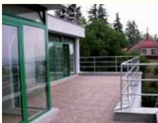
Rekonstrukce vily Praha.