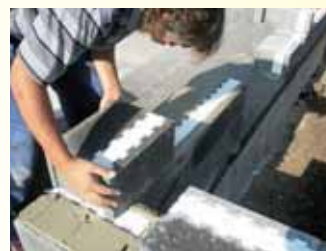
Výstavba rodinného domu.