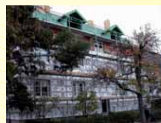
Podkrovní byty Praha.

NABÍDKA SLUŽEB PLATÍ JAK PRO VELKOODBĚRATELE, TAK PRO SOUKROMÉ STAVEBNÍKY