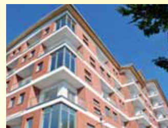
Bytový dům Ústí n. L.