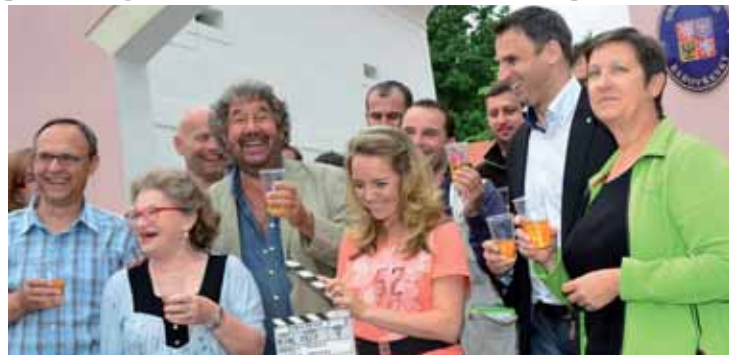
Hejtman Jiří Zimola s aktéry první klapky natáčení komedie Zdeňka Trošky Babovřesky v obci Záboreň na Česko-budějovicku.

Za propagaci Jihočeského kraje, již ve třetím díle komedie Babovřesky, poděkoval hejtman Jiří Zimola režisérovi Zdeňku Troškovi při první české klapce natáčení tohoto snímku. Stalo se tak v úterý 27. května v obci Záboreň na Česko-budějovicku, která spolu s nedalekými Dobčicemi fiktivní visku Babovřesky představují.