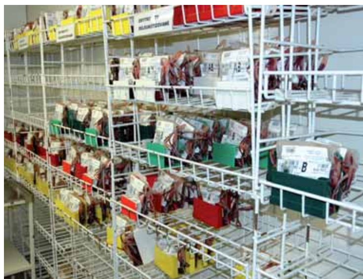
Krevní konzervy jsou uloženy v lednici do doby, než přijde čas a poslouží pacientovi.