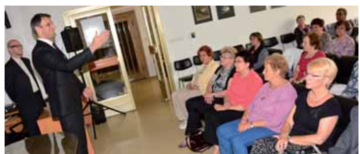
V Jihočeské vědecké knihovně v Českých Budějovicích se hejtman Jiří Zimola zúčastnil závěrečného slavnostního setkání studentů Univerzity třetího věku.

Blahopřejí vám k dokončení studia a zároveň musím říct, že jste svým aktivním přístupem ke vzdělání vzorem pro mladou generaci.