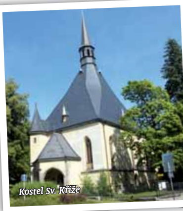
Kostel Sv. Kříže

Město Česká Lípa se rozkládá v severní části České republiky, na obou březích řeky Ploučnice. Se svými 38 000 obyvateli je třetím největším městem české části Euroregionu Nisa. Od hlavního města Prahy je vzdálená 80 km. Město samo, v jehož centru leží památková zóna, je zároveň důležitou křižovatkou cest k Máchovu jezeru, Holanským rybníkům nebo do Lužických hor.