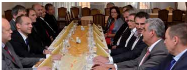
Radní Jihočeského kraje se setkali u pracovního oběda s vrcholnými představiteli jihočeské policie. Řešili hlavně nehodovost na jihu Čech.

„Zásadním tématem byla vzhledem k obrovskému nárůstu nehodovosti dopravní situace a opatření, jak tento nepříznivý stav na jihočeských silnicích změnit. Oproti loňsku tu totiž vzrostl počet nehod o 80 procent a alarmující je zejména počet mladých usmrcených řidičů,“ zdůraznil Zimola. Jednou z cest, která by měla tuto bilanci vylepšit, je podle Zimoly projekt „Zastav jízdu smrti“, na kterém spolupracuje policie s krajem i regionálními médii. V jeho rámci se může například veřejnost seznámit se záběry zničených vozidel či s příběhy účastní-