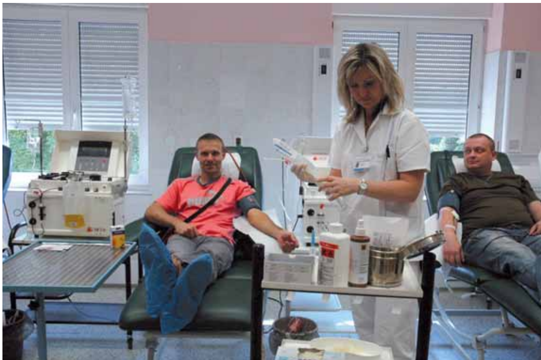
O dárce je na Transfúzním oddělení KNL dobře postaráno.

Čítá téměř 40 lidí, kteří musí zvládat speciální dovednosti, pracují ve