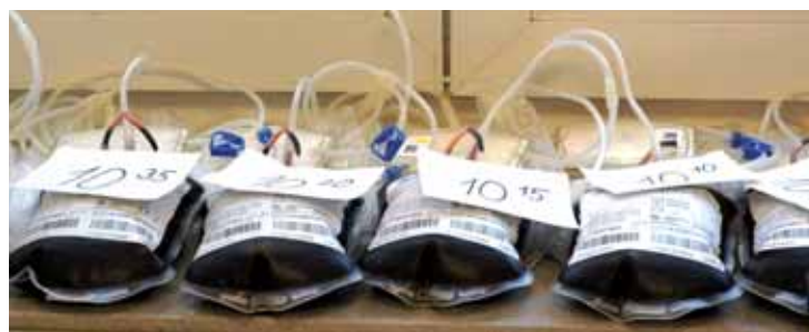
A takhle vypadá čerstvě odebraná krev v konzervě.

jí, ale stoupají požadavky na spotřebu krevních destiček. To je dáno dynamickým vývojem medicíny jako takové, přibývají složitější pacienti. Rostou ale nároky na speciální ošetření transfúzních přípravků, například ozáření, nebo na speciální úpravu transfúzních přípravků.