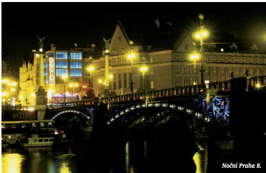
Noční Praha 8.

Obecně lze říci, že není v dobrém stavu. V průměru se můžeme srovnávat s bývalými postkomunistickými zeměmi jako například se Slovenskem nebo Polskem, ale ve srovnání s Německem nebo Itálií či Španělskem jsme s trochou nadsázky stále oněch pověstných sto let za opicemi. Odhaduji, že aby se všechna obce a města dostala na velmi dobrou technickou úroveň, jakou má dnes například Praha, musela by celkem investovat přes 20 miliard korun.