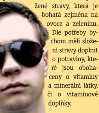
Text: Alš

Na stav lidského zraku má vliv také složení stravy. Zdravé oči nám pomůže udržet konzumace vyvážené stravy, která je bohatá zejména na ovoce a zeleninu. Dle potřeby bychom měli složení stravy doplnit o potraviny, které jsou obohaceny o vitamíny a minerální látky, či o vitamínové doplňky.