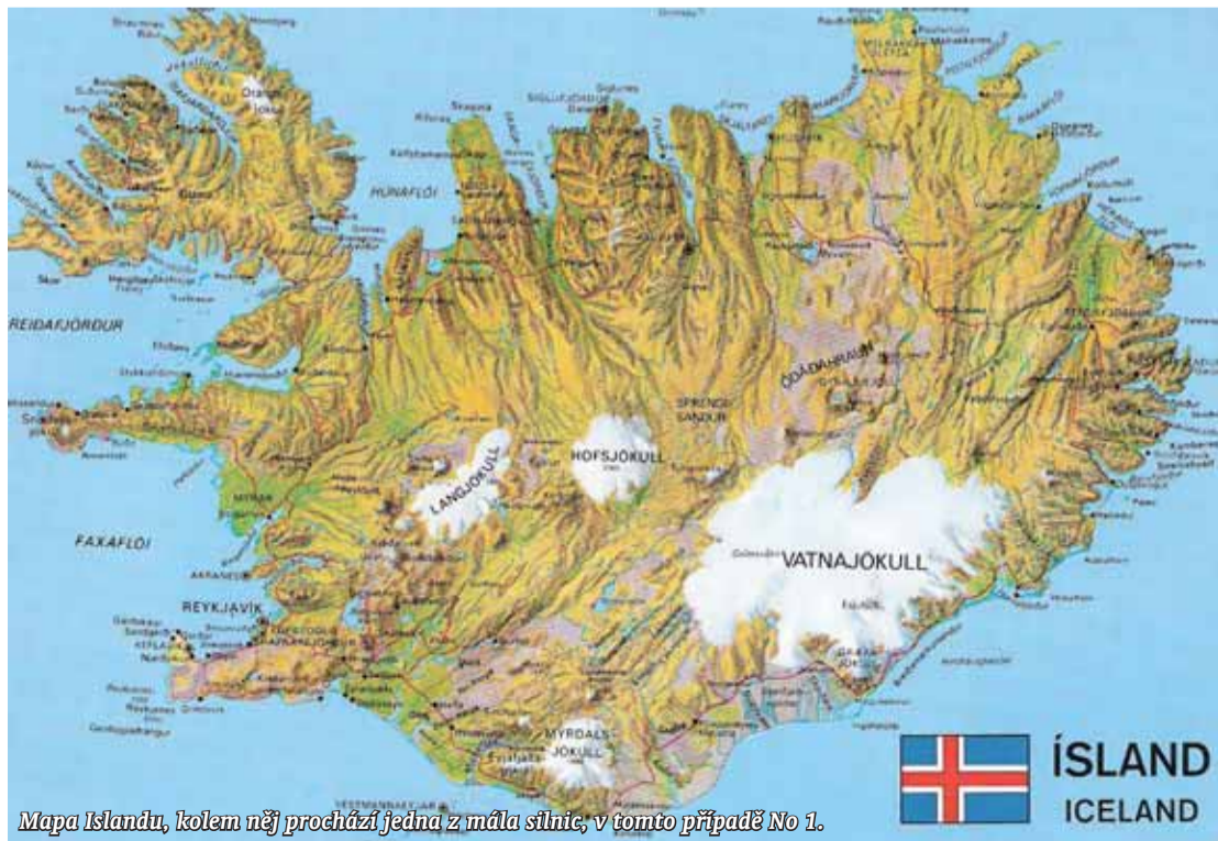
Mapa Islandu, kolem něj prochází jedna z mála silnic, v tomto případě No 1.