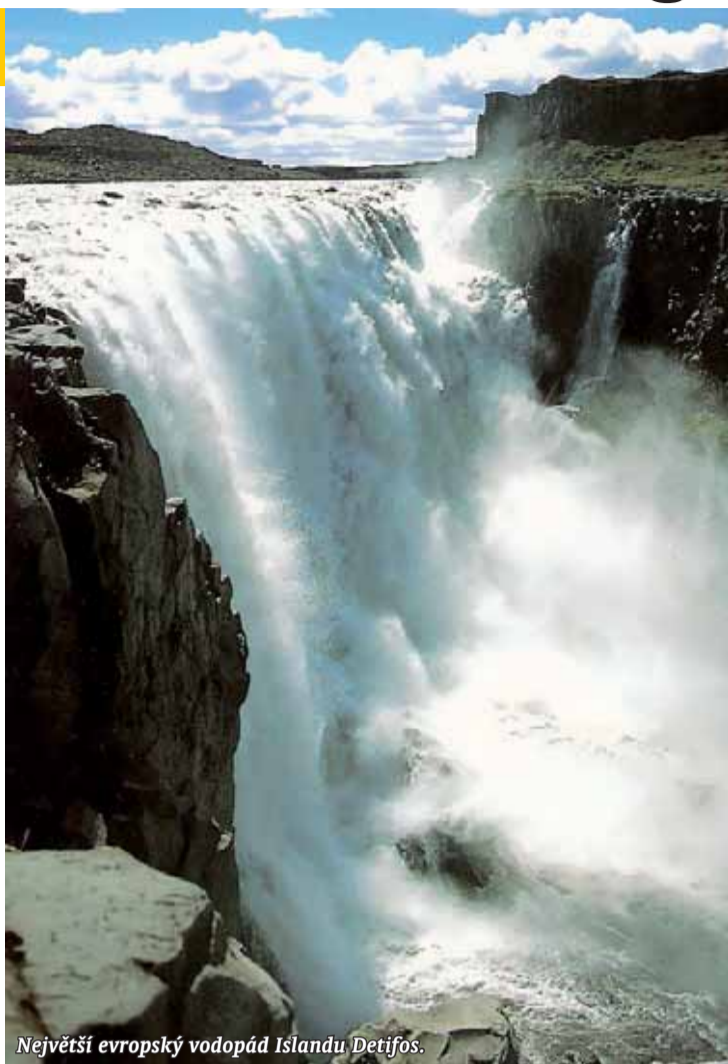
Největší evropský vodopád Islandu Detifos.

Město Hveragerdi v jihozápadní části ostrova je tím, které zajišťuje popularitu Islandu ve světě, jako největšího evropského vývoze tropických plodů – banánů. Skleníky od obzoru k obzoru vyhříváné geotermální energií jsou místem, kde se banánům obzvlášť daří. Jižní pobřeží ostrova se značně liší od severního. Už podnebím. To je zde teplejší a vlhčí, na severu sušší a chladnější. Na druhé straně ale je jižní část Is-