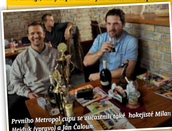
Prvního Metropolit cupu se zúčastnili také hokejisté Milan Hejduk (vpravo) a Jan Čaloun.

Ústí nad Labem | Golf resort Terasy v Ústí nad Labem se stal v poslední květnový den dějištěm prvního turnaje, který uspořádalo vydavatelství Metropolit.