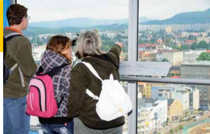
Největší atrakcí dne otevřených dveří byly vyhlídka z terasy budovy Krajského úřadu Libereckého kraje a jízda pater nosterem.

V parku se nezastavily soutěžní atrakce pro děti, které se navíc po-