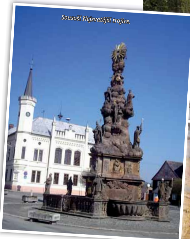
Sousoší Nejsvatější trojice.