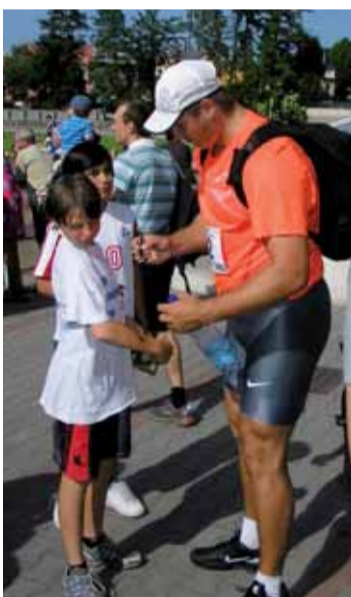
Vítězný Estonec Gerd Känter ve spárech malých lovců autogramů.