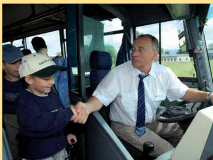
Herec Ivan Vyskočil přivezl děti na oslavu jejich svátku na libereckém letišti.

Liberec | Herec Ivan Vyskočil přivezl autobusem společnosti ČSAD Semily a.s. na liberecké letiště děti ze sedmi dětských domovů Libereckého kraje, které oslavily červnový svátek už 23. května.