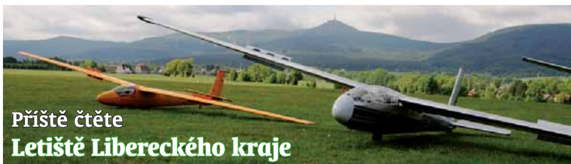
Příště čtete Letiště Libereckého kraje