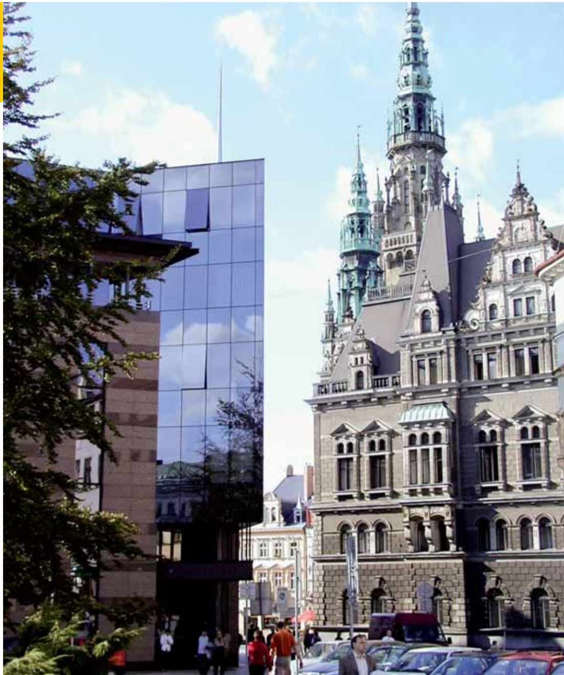
Posudek společnosti Moody's vyzněl pro město Liberec (na snímku budova radnice a Komerční banky) velmi příznivě. Je to vůbec jedno z nejlepších hodnocení, které v poslední době česká města obdržela.

„Liberec vykázal v posledních pěti letech téměř vyrovnané hospodaření,“ píše se v závěrečné zprávě. „Průměrný růst příjmů mírně převýšil růst výdajů a tento trend bude zachován díky výraznému snížení kapitálových výdajů, plánovaných vedením města od roku 2009,“ pokračují analytici společnosti Moody's. Od roku 2007 se Liberec zaměřil na kontrolu růstu běžných výdajů, což v kombinaci s lepším plněním sdílených daní umožnilo růst poměru provozních přebytků k běžným příjmům. V roce 2008 tak dosáhl hrubý provozní přebytek Liberce téměř 10 procent běžných příjmů, což je velmi dobrý výsledek. V uplynulých letech se podle zprávy Moody's podařilo získat velké finanční prostředky od státu. „Mezi lety 2004 a 2008, kdy Liberec modernizoval svá sportovní zařízení, školy