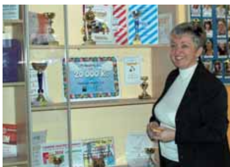
Certifikát od společnosti CPI Reality zdobí vitrínu vestibulu ZŠ Vojnovičova, kde jsou uloženy nejcennější trofeje školy.