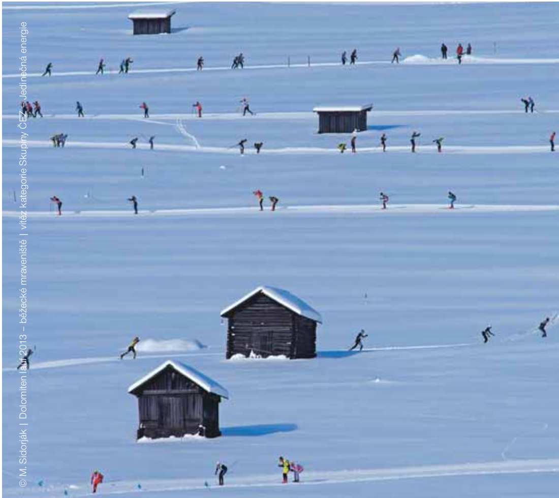
Dolomiten Jan. 2013 – běžecké mraveniště | vítěz kategorie Skupiny ČEZ – Jednotná energie