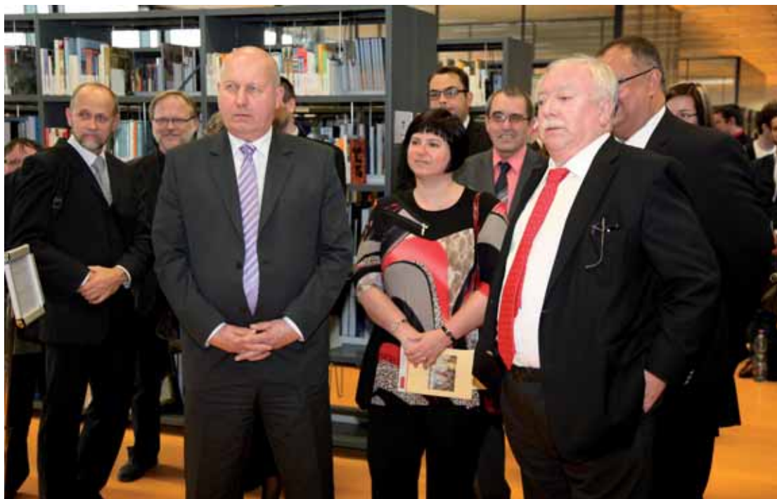
Na snímku z otevření Rakouské knihovny jsou v popředí zprava starosta města Vídně Michael Häupl a hejtman Ústeckého kraje Oldřich Bubeníček.

Vznikem Rakouské knihovny v rakouském městě se zařadí ústecká univerzita a město samotné do prestižní mezinárodní sítě Rakouských knihoven, které jsou zřizovány a podporovány Spolkovým ministerstvem pro Evropu, integraci a zahraniční věci ve Vídni. Studentům i zájemcům z řad veřejnosti tu knihovnici nabízejí tři tisíce knihovních svazků z oblasti beletrie, historie, filozofie, politiky, ekonomie, vzdělávání, dějin umění, architektury, výtvarného umění či tzv. gender studies (rovné příležitosti). Kromě toho bude Rakouská knihovna nabízet řadu obrazových publikací vztahujících se k Vídni. Ústecká pobočka Rakouské knihovny mohla být založena díky sponzorskému daru 20 tisíc