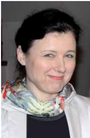
Ministryně pro místní rozvoj Věra Jourová oznámila v Litoměřicích, že do Ústeckého kraje půjde sto milionů korun na podporu zaměstnanosti.

„Tento dotační titul může výrazně pomoci při vytváření nových pracovních míst v Ústeckém kraji. Díky němu by mohlo vzniknout alespoň 200 nových