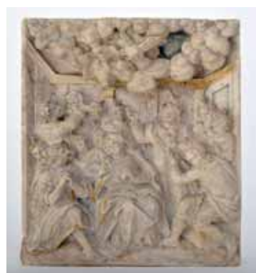
Reliéf – Sslání Ducha svatého, je nyní vystaven v Severočeské galerii výtvarného umění v Litoměřicích.

Tyto kopie pro Národní památkový ústav – územní pracoviště v Ústí nad Labem zhotovuje Střední průmyslová škola kamenická a sochařská v Hořicích. Byla použita v tuto chvíli nejmodernější dostupná technologie ATOS s metodou „parametrické inspekce“, kdy je vlastní skenování kombinováno s fotogrammetrií pro skenování velmi složitých objektů. Vysoká přesnost v setinách milimetrů bude využita pro dokončení matematického modelu ve 3D, z něhož bude zhotoven přesný model. Ten bude východiskem pro tvůrčí ma-