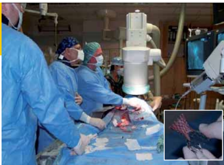
Při nové metodě náhrady nemocné chlopně perkutánní cestou, tedy přes tepnu v pravém tříse, je chlopně připravena na zaváděcí cévku, která se přes tepny zavede až do místa nemocné chlopně, kde dojde k uvolnění a umístění chlopně nové.

Jde o převratný výkon, který znamená zásadní změnu v léčbě nemocných se srdečními vadami. „Chtěl bych zdůraznit, že za úspěšným zvládnutím tohoto výkonu stojí příprava, do které je zapojena celá řada odborníků kardiologů, anesteziolo-