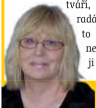
Sestavila: Ludmila Petříková

♓ Ryby 20. 2. - 20. 3. Těšte se na setkání s člověkem, kterého nemůžete ve svém životě minout. Ať už vám přinese lásku, platonické souznění duší nebo přátelství, bude to setkání, které se nesmazatelně vryje do vašeho srdce.