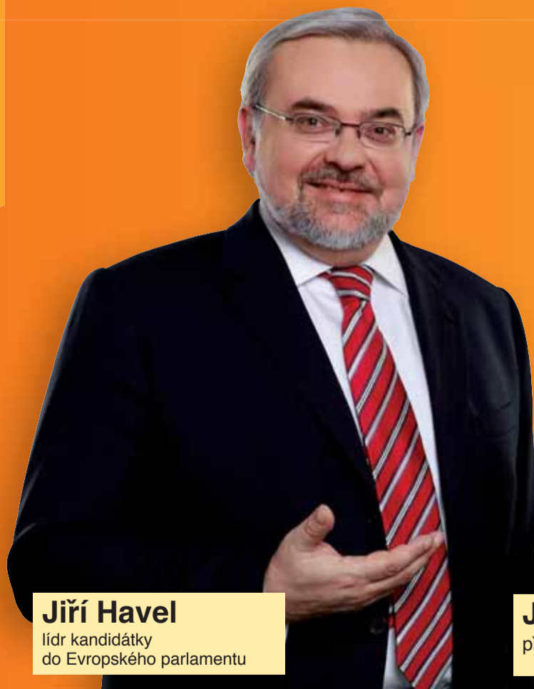
Jiří Havel lídr kandidátky do Evropského parlamentu