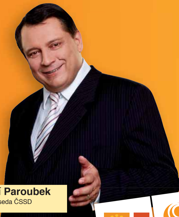
Jiří Paroubek předseda ČSSD

5. a 6. června přijďte k volbám do Evropského parlamentu