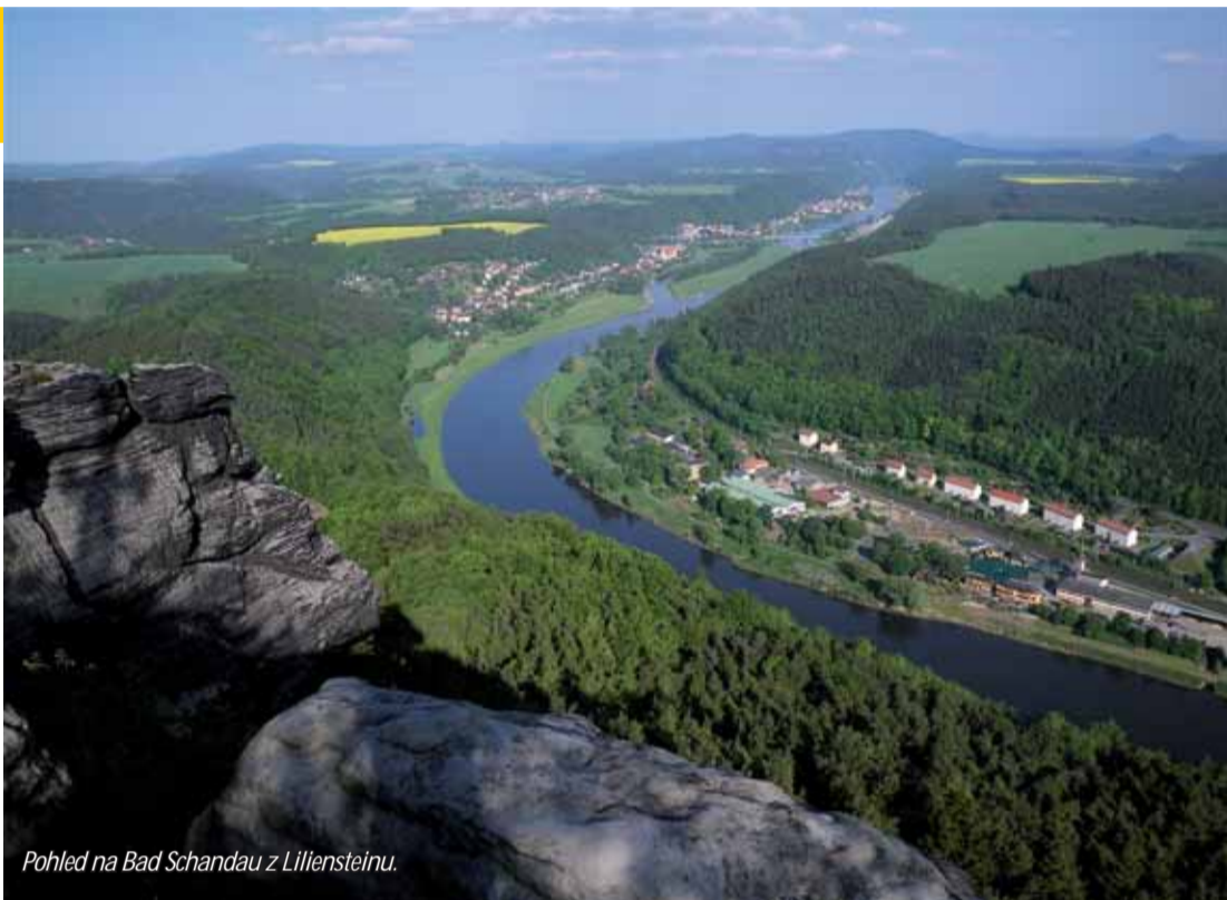
Pohled na Bad Schandau z Liliensteinu.