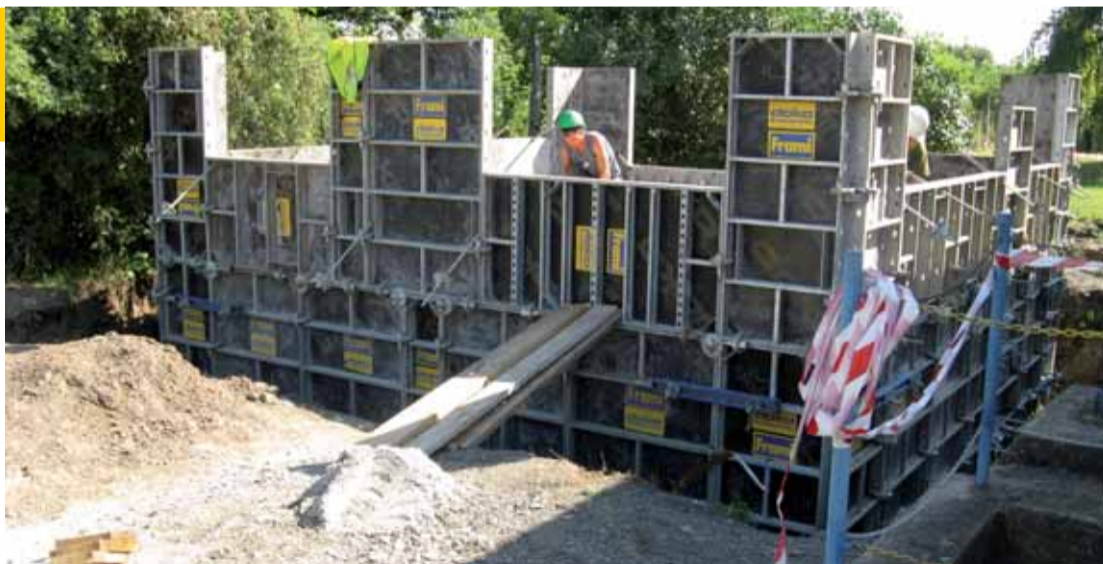
Dolní Labe - rekonstrukce ČOV Podbořany - bednění fekální jímky.

Společně pro všechny uvedené stavby je to, že řeší nakládání s odpadními vodami v souladu s novou přísnější legislativou v uvedených městech v povodí Ploučnice. Cílem projektu je splnění Směrnice rady 91/271/EHS, která stanovuje limity pro vypouštění odpadních vod do vod povrchových. Čistými odpadními vod budou po rekonstrukci vybaveny novou účinnější technologií, dojde i ke změně řízení procesů a tím k vyšší spolehlivosti. Co se týče kapacity čistíren odpadních vod, dvě jsou ve velikostní kategorii nad 10 000 EO (ekviva-