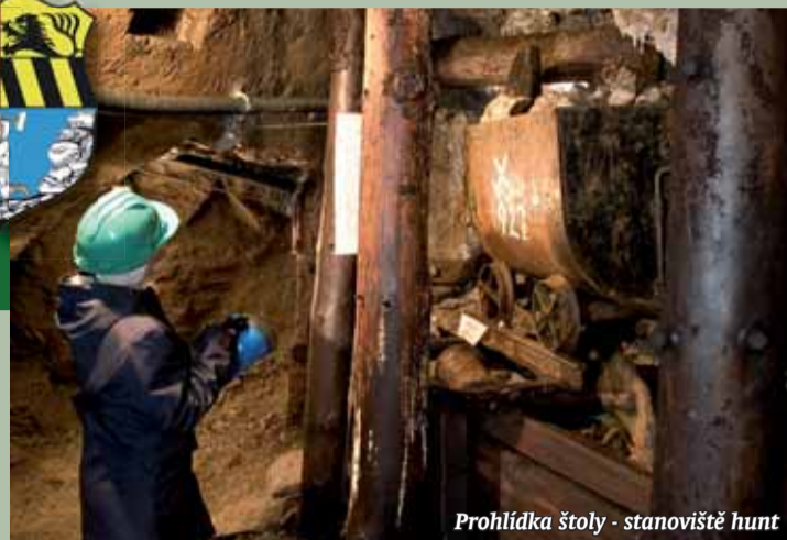
Prohlídka štoly - stanoviště hunt

s její minerální výplní, sbírku historických předmětů, přehled znaků všech hornických měst v ČR a výstavu minerálů a hornin. Atrakcí je „Pramen štěstí“ a krápníková výzdoba. Atrakcí je