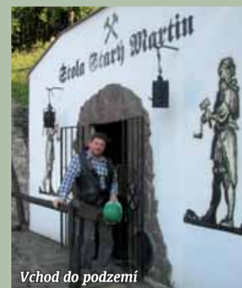
Vchod do podzemí

s její minerální výplní, sbírku historických předmětů, přehled znaků všech hornických měst v ČR a výstavu minerálů a hornin. Atrakcí je „Pramen štěstí“ a krápníková výzdoba. Atrakcí je