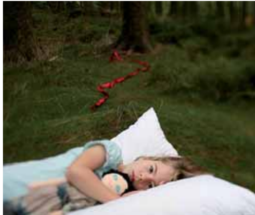
Záběr z vítězného snímku Kdopak by se vlka bál.

Kdyby chtěl někdo vidět všechny filmy a dokumenty, které servoval v Plzni 22. ročník festivalu Finále, musel by oželeť spánek. Letos se totiž během prestižní přehlídky českého filmu uskutečnilo 150 projekcí. Do soutěže o hlavní cenu Zlatého ledňáčka se dostalo 12 celovečerních snímků a 24 dokumentů. Porota přičkla prvenství filmu režisérky Marie Procházkové Kdopak by se vlka bál a dokumentu Česká RAPublika režiséra Pavla Abraháma. Pozornost vzbudil film U mě dobrý s Bolkem Polívkou, Josefem Somrem, Miroslavem Vladykou a dalšími. Během týdne mohli diváci v Plzni vidět výběr toho nejlepšího ze současné české filmové produkce i snímky, které jsou klenoty tuzemské kinematografie. V archivní části se festival vrátil