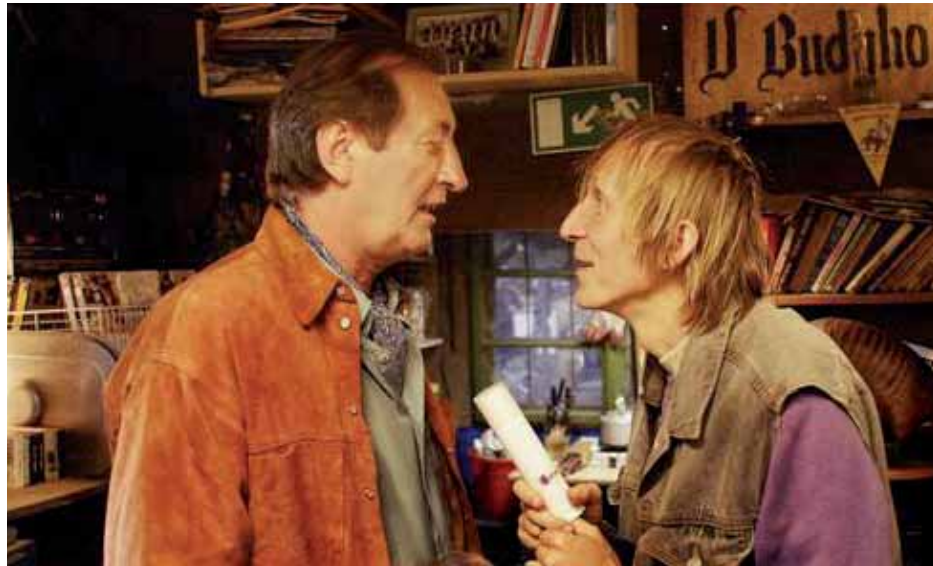
Z filmu U mě dobrý.

do pohnutého roku 1969. Publikum si získala například velká retrospektivní pocta režiséra Věře Chytilové či sekce věnovaná jednomu z nejosobitějších českých režisérů Františku Vlácilovi.