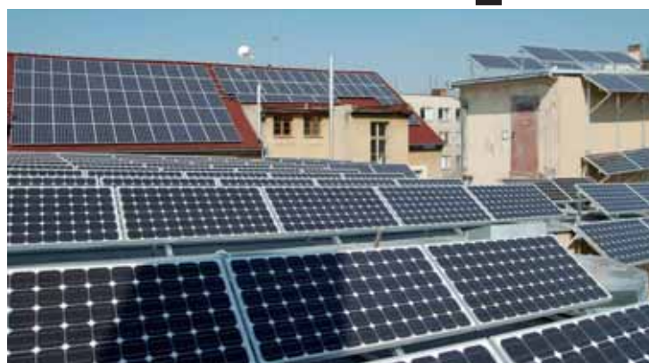
Solární panely testuje firma na domech v Plzni

nu o výkonu 64 kW. Strašický park bude podle něho nejvýkonnější proto, že jeho díly od různých výrobců budou vždy „napasovány“ na české klimatické podmínky, kde svítí slunce v průměru jen sto dnů v roce. Firma se proto soustředí na využití zamračených dnů a jiných světových stran než tradičního jihu. „Testujeme nejvýkonnější panely od sedmi výrobců z USA, Číny a Německa a 13 různých investorů (převodníků ze stejnosměrné na střídavou elektřinu),“ řekl majitel. Podnik bude mít na třech hektarech pozemku koupeného od obce Strašice na Rokycansku stacionární i otáčivé solární panely, tzv. trackery ze-