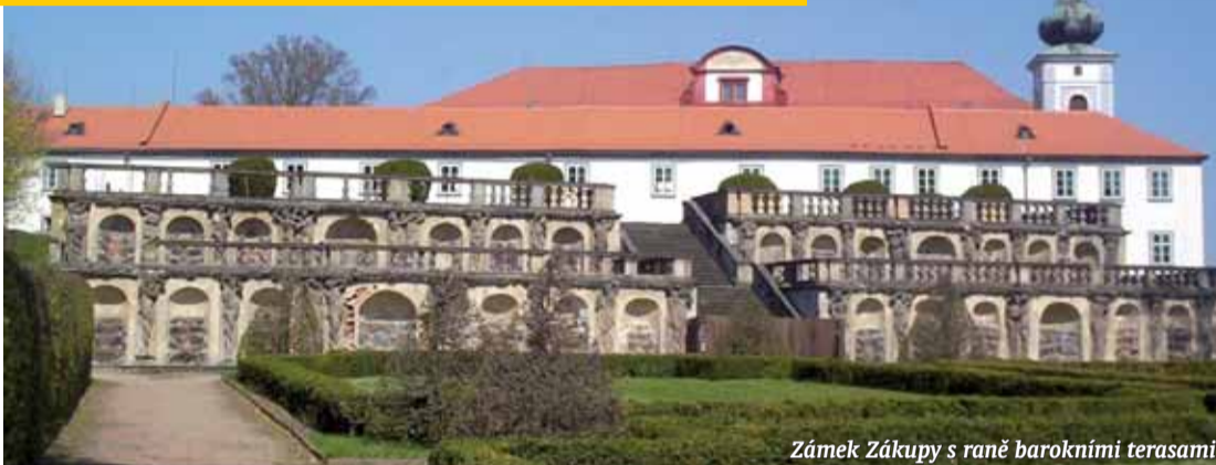
Zámek Zákupy s raně barokními terasami

Po pár kilometrech nás přivítá obec Svojkov. Po levé straně zhlédneme malý kostelík s řadou vysokých skal v zádech. Projedeme obcí až k rozcestníku u malé hospůdky. K Modlivému dolu stoupáme asi deset minut. Koneč-