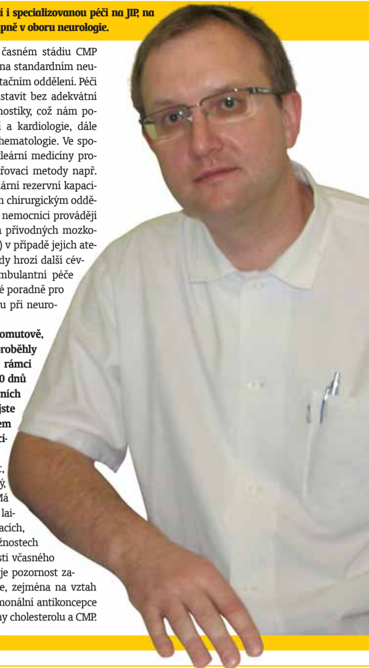
Krajská zdravotní, a. s.