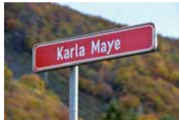
Uliční cedule v Brně.

teraturou pro mládež. Fenomén Karla Maye a jeho náčelníka Apačů Vinnetoua a dalších hrdinů zažil návrat v šedesátých letech 20. století v sou-