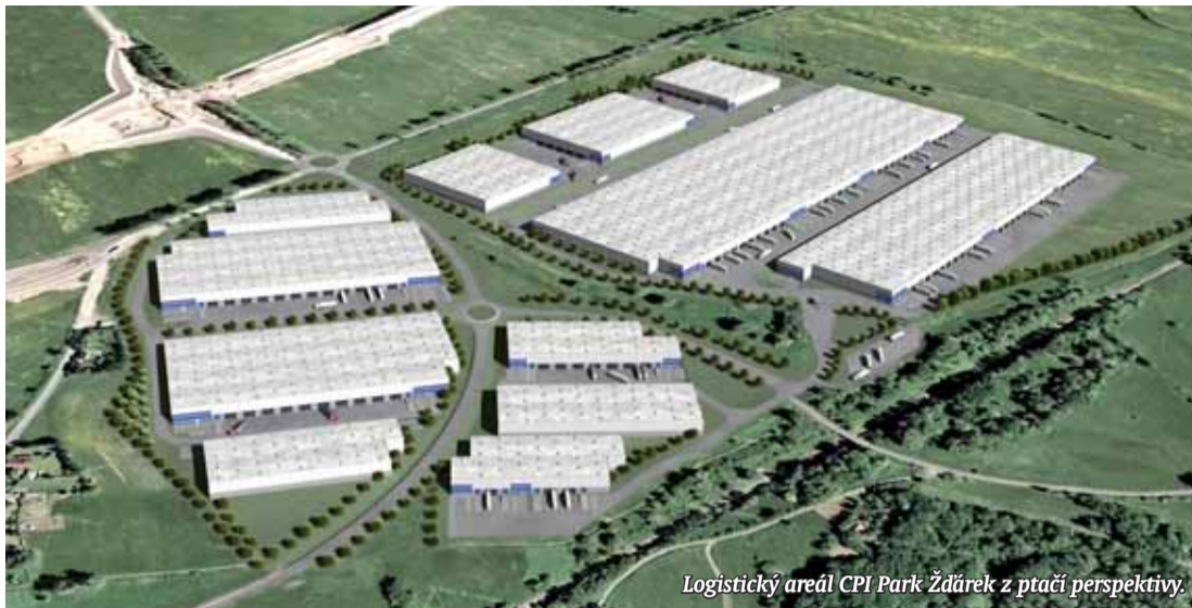
Logistický areál CPI Park Žďárek z ptáčích perspektiv.

Ústecký kraj patří společně s Moravskoslezským k regionům s nejvyšším počtem nezaměstnaných lidí v produktivním věku. Vedení obou krajů se proto snaží na svá území nalákat významné investory. Jedním z takových je akciová společnost Czech Property Investments, která chce nedaleko obce Libouchec na Ústecku vybudovat Logistický areál Park Žďárek.