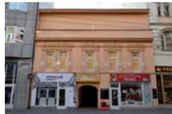
Dům knihkupce F. Krügera v Revoluční ulici v Ústí nad Labem.

krádeže a podvody, za které si pak odseděl několik let ve vězení. Zde se napravil, ale první stálé zaměstnání po návratu z vězení mu přátelé našli až v Ústí nad Labem, kde pracoval pro časopis „Schacht und Hütte“. Teprve poté se začal věnovat literatuře a stal se jedním z nejčtenějších autorů dobrodružné literatury. Do Ústí nad Labem se vrátil v roce 1897, když během několika týdnů v dnešním penzionu Srdičko v Brně napsal román Vánoce. Český vyšel text Karla Maye poprvé již v roce 1888 a byl to vůbec prv-