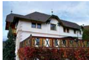
Penzion Srdičko, Ústí nad Labem-Brná.