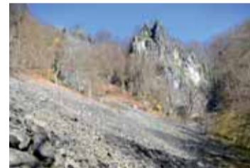
Krajina Českého středohoří nedaleko Brně.