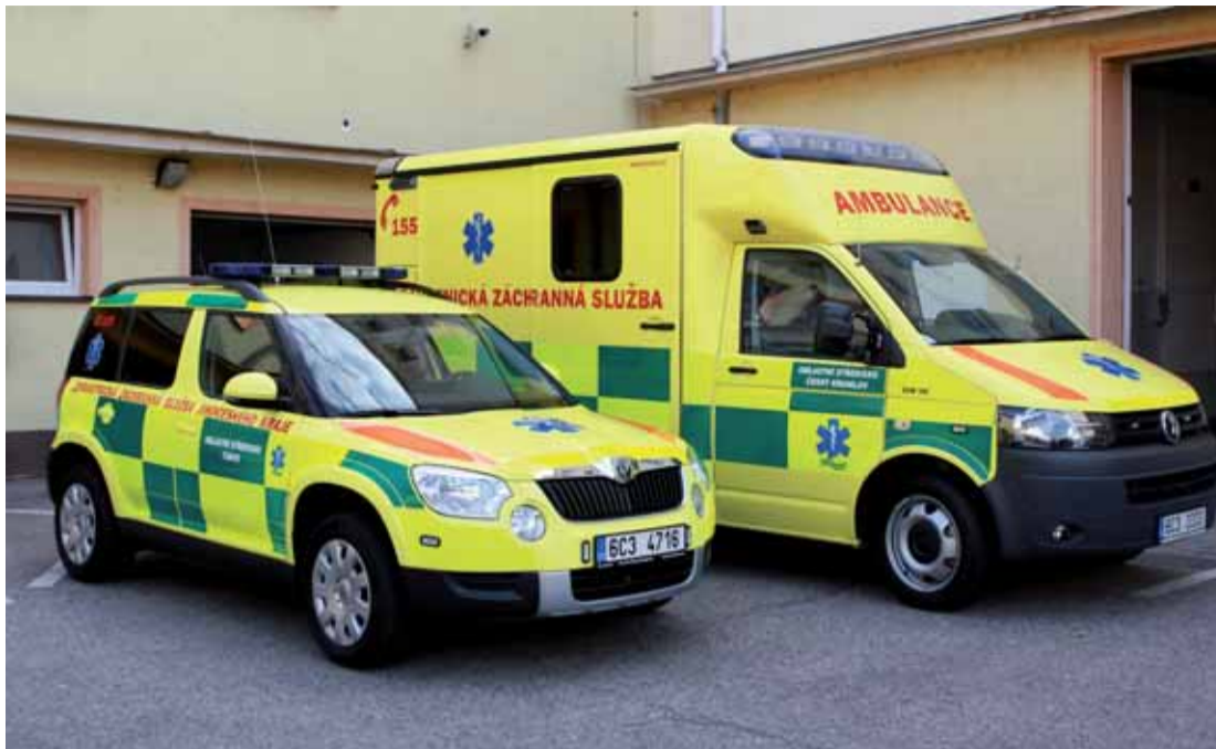
Na snímku je klasická sanitka a malý vůz, který přepravuje lékaře.

Slabý, který vyráží do terénu i jako lékař ZZS JČK, si tento systém pochvaluje. „Dříve jsme byli uvázaní k jedné sanitě a během výjezdu bylo velmi obtížné se dostat k jinému případu. Řešilo se to velmi krko-