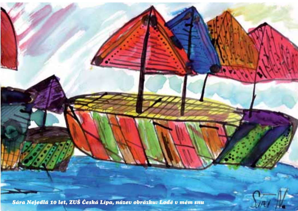
Sára Nejedlá 10 let, ZUŠ Česká Lípa, název obrázku: Lodě v mém snu