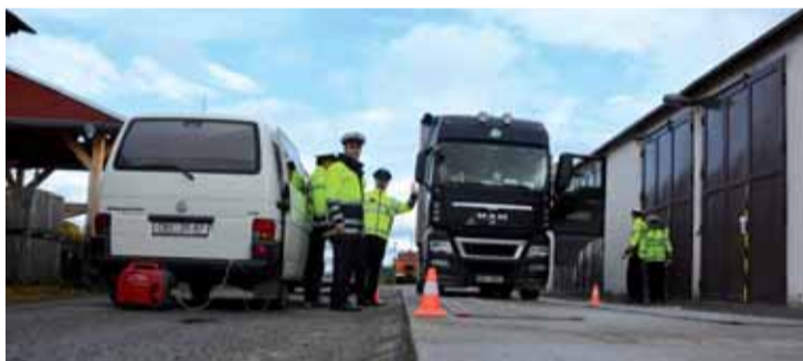
Kontrola kamionu v areálu Správy a údržby Jihočeského kraje v Českém Krumlově.

Jihočeský kraj na repasi policejních vah přispěl částkou 15 000 Kč a dal-