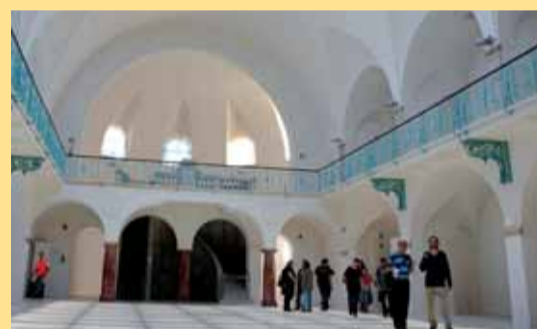
Interier Městských lázní v Liberci – ukázka práce.