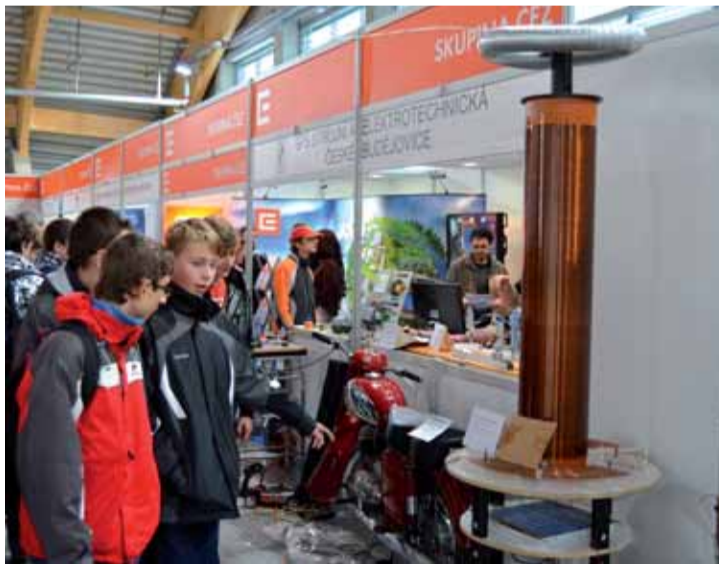
Veletrh Vzdělání a řemeslo na českobudějovickém výstavišti.

kých kádrů, si uvědomují jak zřizovatelé středních škol, kterým je v tomto případě Jihočeský kraj, tak i sami zaměstnavatelé a personalisté. Proto své budoucí zaměstnance, i vzhledem k nutnosti přirozené generační obměny, hledají už přímo na školách. Nechybí přitom ani různé motivační programy. Například Jihočeský kraj uvolňuje ročně okolo 3,5 milionu korun na stipendia pro studenty vybraných technických učebních oborů. „Podporujeme obory, které trh práce požaduje. Učňovská stipendia mají přísné podmínky, kam patří mimo jiné dobré studijní výsledky, docházka a podobně. Kraj vedle toho podporuje rozvoj technického vzdělávání i prostřednictvím jiných projektů, nyní například patnáct jihočeských středních škol spolupracuje každá se čtyřmi základními školami, jejichž každý žák se může seznámit už dopředu s formou studia na už zmíněných středních školách. Přímou spolupracujeme s celou řadou firem, jejichž vlnou lodí je nesporně společnost ČEZ, respektive Jaderná elektrárna Temelín, ale i firmy jako Bosch, Siemens, Kovosvit, Engel, Groz - Beckert a další,“ zdůraznila ve-