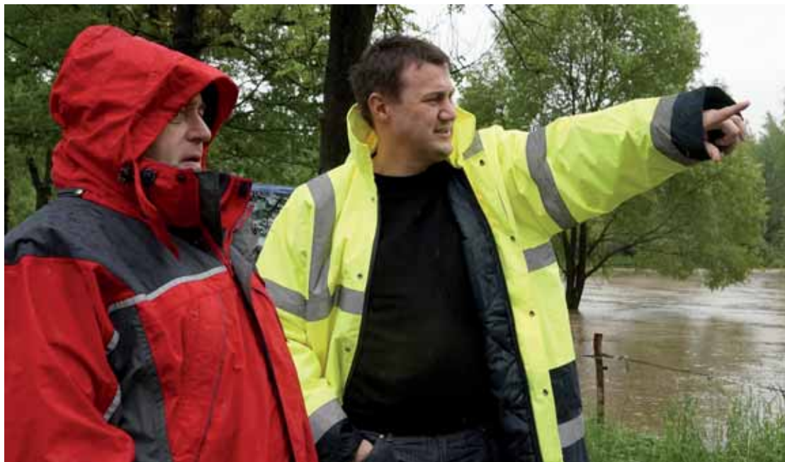
Nejsložitější situace, povodeň 2013 s největšími škodami, řešil hejtman (vpravo) na Frýdlantsku.

V uplynulém volebním období jsme byli v krajském zastupitelstvu v opozici a chtěli změnit věci směrem k otevřenému kraji. Za úspěch považuji to, že dnes kraj zveřejňuje všechny smlouvy, máme rozklikávací rozpočet, transparentní účty. Všechny věci, které se projednávají na zastupitelstvu, si může zastupitel i občan předem přečíst na