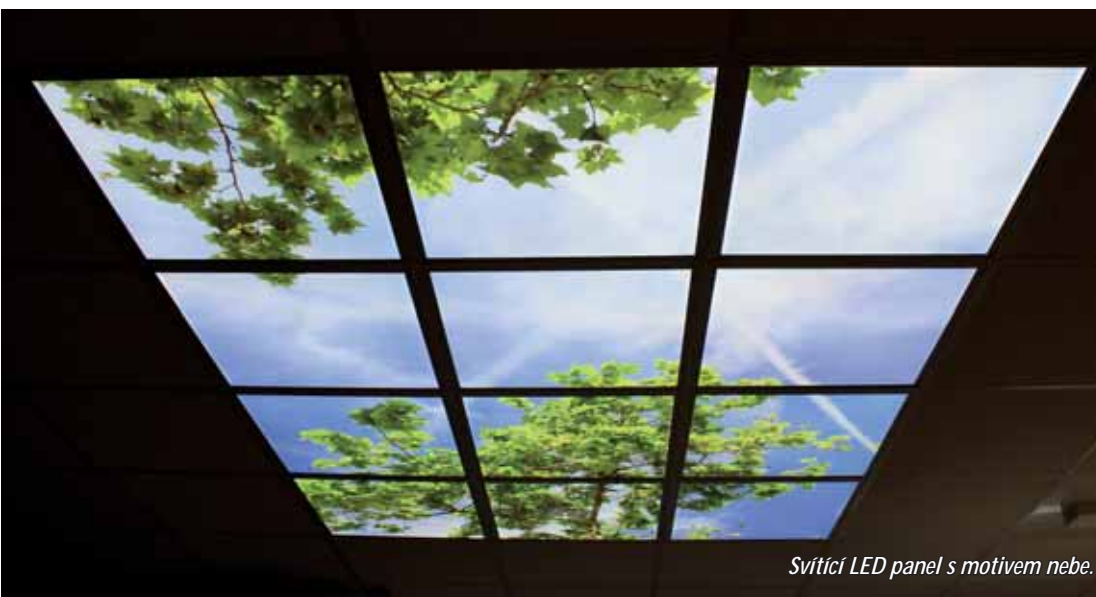
Svítící LED panel s motivem nebe.

řujeme také spolupráci s institucemi a v neposlední řadě také značně rozšiřujeme vzdělávací aktivity.