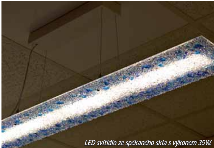
LED svítidlo ze spěkaného skla s výkonem 35W.

LED moduly. Tento projekt byl podpořen z ESF a rozpočtu ČR, ale realizovali jsme a plánujeme další investiční projekty také z vlastních zdrojů bez podpory, to podtrhuje, jak této technologii věříme. Můžu zmínit budoucí přístavbu montážní haly zaměřené na montáž LED svítidel, výstavbu skladovací haly nebo například další zajímavý projekt, který je zaměřen na vznik nových laboratoří pro testování svítidel, tento projekt má schválenou podporu z ESF a rozpočtu ČR. Je nutné také optimalizovat výrobu ve vztahu k zavádění nových inovovaných produktů a také neustále se měnícímu se podílu obratu výroby svítidel s LED technologií oproti ostatním svítidlům. Není to však snadné. Kdo se zabývá LED technologií ve světelné technice, jistě vám potvrdí, jak se velice dynamicky tato technologie rozvíjí v posledních letech. Rozši-