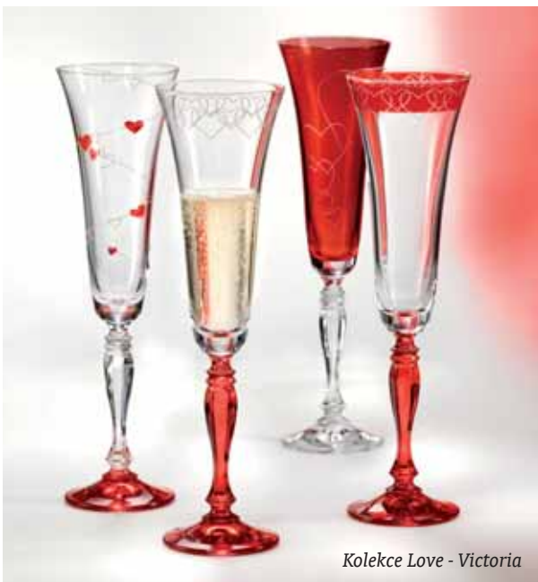
Kolekce Love - Victoria