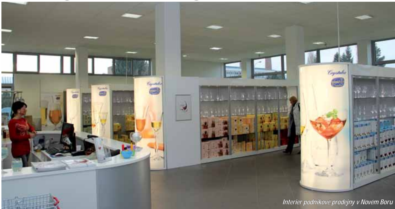
Interier podnikové prodejny v Novém Boru