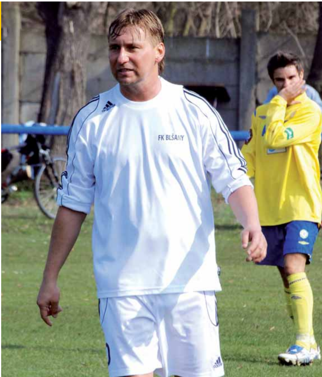
Text a foto: Edvard Beněš

Samozřejmě. Hráť dobrý fotbal, vyhrávat, získávat body a zachránit Blšany.