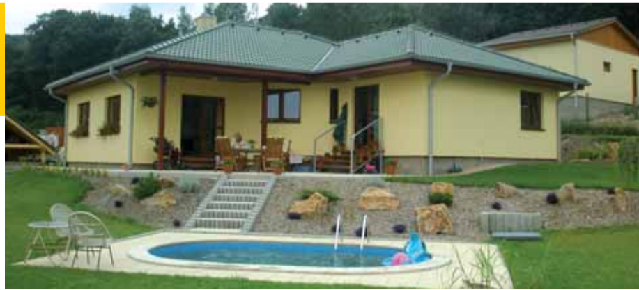
Jeden z referenčních nízkoenergetických domů montovaných firmou MONED s. r. o. je k vidění v Krupce.

„Pro zájemce, kteří umějí kalkulovat s cenami staveb v různých provedení a také s cenami energií a uvažují o pořízení domu např. z naší nabídky, mohu uvést jeden příklad. Dům 3 či 4+1, v nízkoenergetickém provedení, zastavěná plocha 135 metrů čtverečních, užitná plocha 116 metrů čtverečních, jsme schopni postavit za 2,6 až 2,8 milionu korun. Přičemž zákazník se do něho může nastěhovat za 90 dní,“ říká spoluzakladatel firmy MONED s. r. o. Pavel Nešpor. Firma vedle montovaných rodinných domků, roubenek a staveb pro rekreaci dodává a montuje