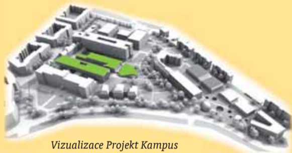
Vizualizace Projekt Kampus Univerzity Jana Evangelisty Purkyně

kladech 420 milionů korun (z toho 405 milionů ze státního rozpočtu). Jsou to prostředky, které nemohou být získány z projektů financovaných z evropských fondů – konkrétně operačního programu pro výzkum a vývoj, a proto bylo Ministerstvem školství mládeže a tělovýchovy navrženo financování z programu rozvoje a obnovy materiálně technické základny veřejných vysokých škol v období let 2009 až 2011. (ik)