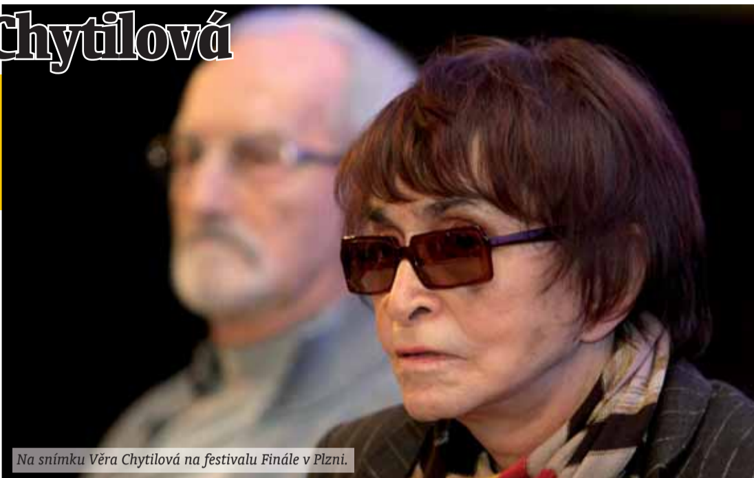
Na snímku Věra Chytilová na festivalu Finále v Plzni.