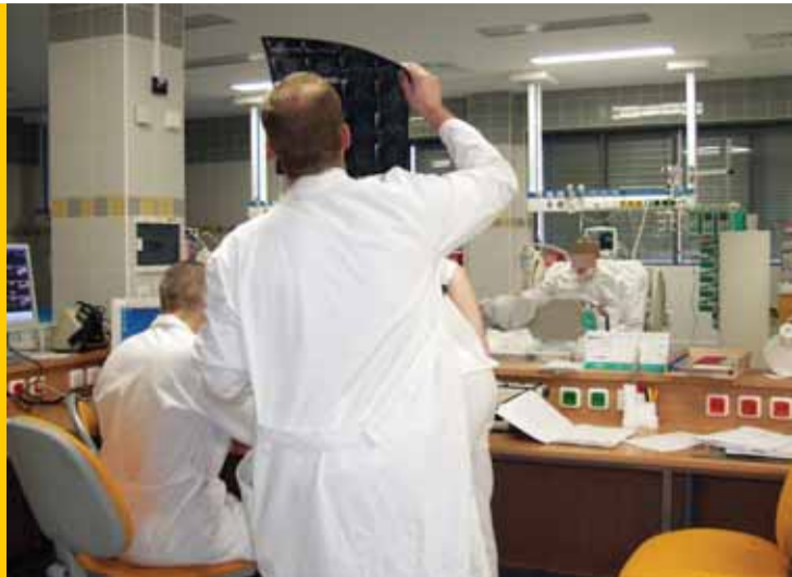
Posuzování rentgenových snímků včera...