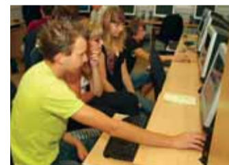
Studenti mosteckého gymnázia v nové multimediální učebně.

Most, Chomutov | Téměř třiceti miliony podpořila loni Mostecká uhelná, a. s., region Mostecka a Chomutovska. Horníci např. pomohli zřídit multimediální učebnu v Gymnáziu T. G. M. v Litvínově, v Gymnáziu v Mostě, ve Střední průmyslové škole v Duchcově či ve Vyšší odborné škole zdravotnické a Střední škole zdravotnické v Mostě. (tob)