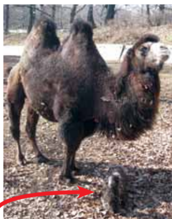
Velbloudího klučinu byste asi bez upozornění na fotce nepoznali. Na svět přišel nečekaně dříve. Porod v přímém přenosu sledovali návštěvníci zooparku.