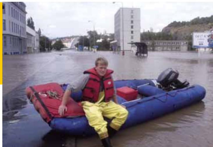
Ilustrační foto z povodní.

Běžný občan si bude moci jednoduchým způsobem na přehledných mapách zjistit, zda například v mis-