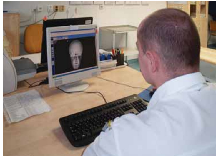
... a dnes.

Přeloženo do normálního jazyka znamená „filmless“ provoz, že veškeré RTG snímky a výsledky dalších specializovaných vyšetření (magnetická rezonance, CT, ultrazvuky, angiografie) jsou zdravotníkům přístupny v počítači v digitální podobě. Odpadá tím nutnost čekání na vyvolání fotografií z vyšetření a výsledky jsou ihned po jeho provedení uloženy ve společném počítačovém systému a zdravotník je tak má okamžitě k dispozici. Další výhodou tohoto přístupu je i to, že v rámci Krajské zdravotní je možné tato data nechat posoudit zdravotníkem - specialistou v jiné nemocnici v rámci celé společnosti bez toho, aby pacient musel být transportován jinam, či aby tento odborník naopak musel přijet za pacientem nebo za svým kolegou do jiné nemocnice.