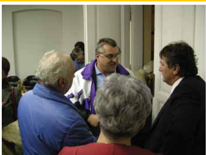
Jiří Šulc mezi občany na hejtmanském dnu v Litoměřicích.