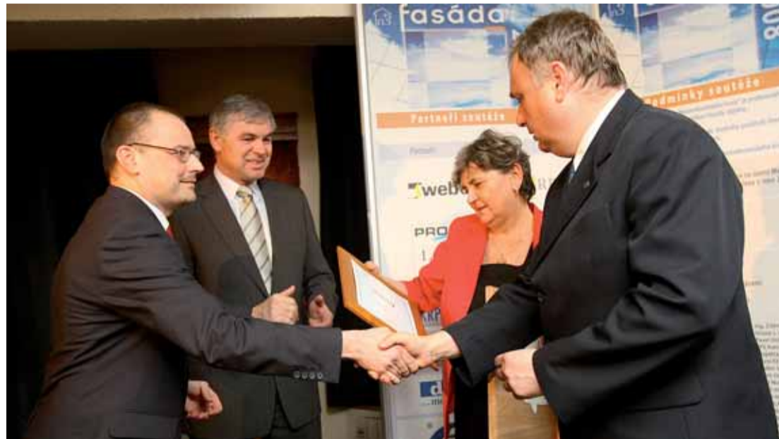
Je dobojováno! Prestižní soutěž Fasáda Moravskoslezského kraje 2008 už zná své vítěze.