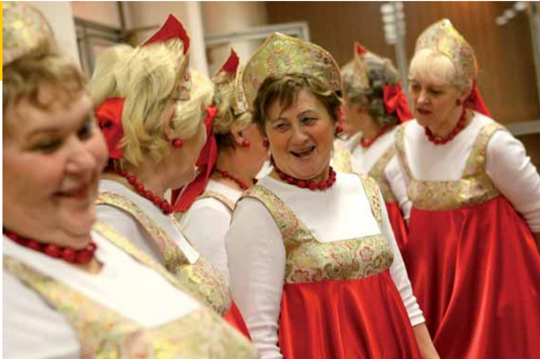
Mažoretky z Horní Lhoty umí publikum dostat do pomyslného varu. Každé jejich vystoupení slibuje neopakovatelné zážitky.

Přátelské vztahy v souboru ovlivňuje fakt, že se všechny důvěrně znají, protože v něm působí výhradně švagrové, tety, případně kamarádky z vesnice. Příchod nové členky ale nelze vyloučit. Svým způsobem stačí maličkost. „Rozhodně by ta holka měla mít více než padesát kilogramů, klidně by mohla být plnoštíhlá. Každopádně by však měla pocházet z Horní Lhoty, protože kdyby byla odjinud, tak by vůbec nestihala. Dojíždění je časově hodně náročné. Pokud navčujeme nový program, tak běžně cvičíme třikrát týdně po dvou až po třech hodinách,“