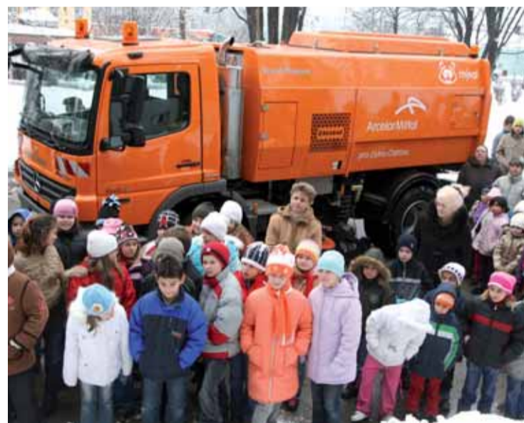
O ostravské ulice v obvodech Slezská Ostrava a Radvanice a Bartovice pečuje Mýval. Tak se jmenuje čistící vůz za více než čtyři miliony korun, který těmto obvodům věnovala společnost ArcelorMittal Ostrava.

Ta si uvědomuje svůj vliv na okolní region, a proto připravila vícero projektů, kterými se snaží vylepšit životní prostředí. Už dříve se například započalo s výsadbou 1 111 stromů na Ostravsku.