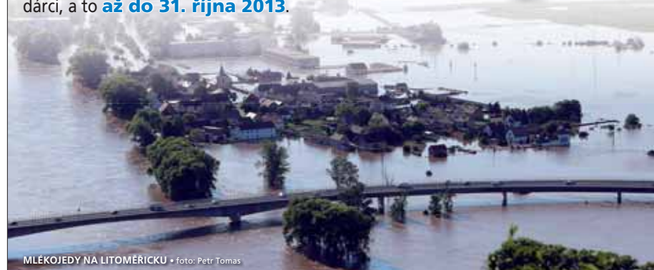
MLEKOJEDY NA LITOMĚŘICKU