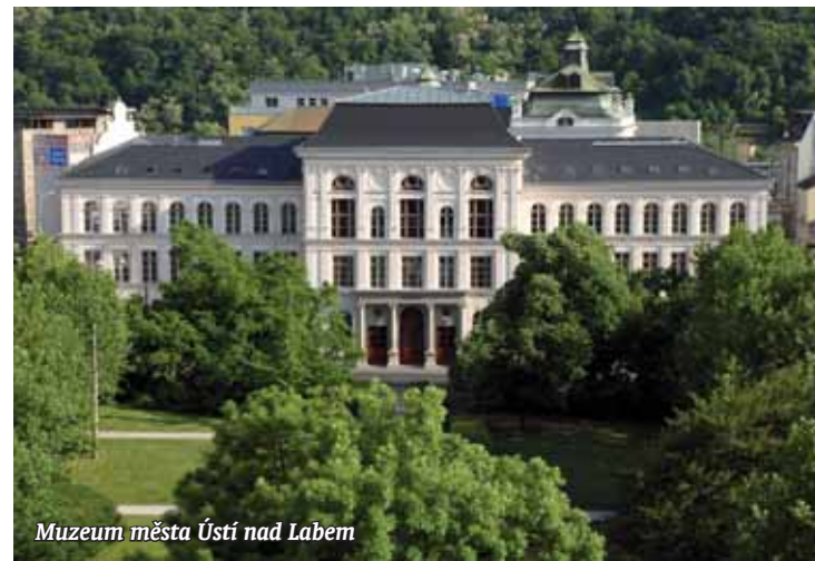
Muzeum města Ústí nad Labem

nějších tvůrců těchto hudebních nástrojů v Evropě v 1. polovině 19. století Conrada Gráfa, který je vůbec nejstarším dochovaným nástrojem tohoto autora na světě. Samozřejmě, že se návštěvníci muzea na výstavě dozvědí o podobě a životě města Ústí nad Labem v roce 1813 a o dramatických událostech, které se týkaly jeho obyvatel. Válečné události z roku 1813 se dočkaly také řady pomníků a pamětních desek, z nichž nejvýznamnější se nacházejí na samotném historickém bojišti. Na výstavě je vůbec poprvé možné