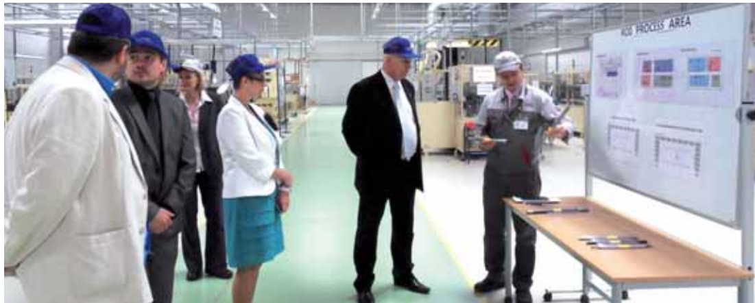
Hejtman Oldřich Bubeníček si prohlédl mimo jiné závod Hitachi v průmyslové zóně Triangle.

Již podruhé zavítal na návštěvu investorů ve strategické průmyslové zóně Triangle u Žatce hejtman Ústeckého kraje Oldřich Bubeníček.