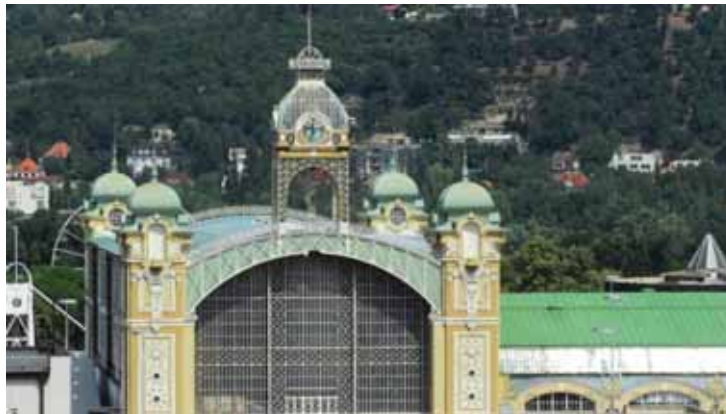
Pohled na Průmyslový palác z výšky.

Důvodem je podle náměstka primátora Václava Novotného enormní finanční zátěž celého projektu. „Vzhledem k současným rozpočtovým podmínkám hlavního města je třeba hledat levnější způsob, jak opravit nejen palác, ale i další objekty v areálu