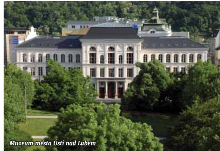
Muzeum města Ústí nad Labem

nějších tvůrců těchto hudebních nástrojů v Evropě v 1. polovině 19. století Conrada Gráfa, který je vůbec nejstarším dochovaným nástrojem tohoto autora na světě. Samozřejmě, že se návštěvníci muzea na výstavě dozvědí o podobě a životě města Ústí nad Labem v roce 1813 a o dramatických událostech, které se týkaly jeho obyvatel. Válečné události z roku 1813 se dočkaly také řady pomníků a pamětních desek, z nichž nejvýznamnější se nacházejí na samotném historickém bojišti. Na výstavě je vůbec poprvé možné