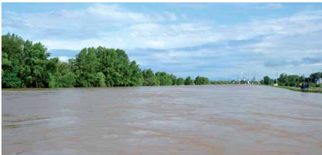
Rozvodněné řeky napáchaly spousty škod. Středočeský kraj před tím nezavírá oči.