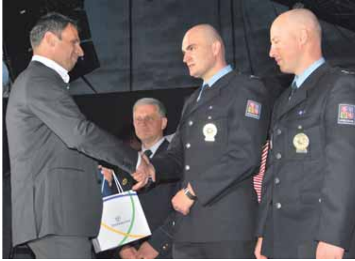
Jihočeský hejtman Jiří Zimola předává ocenění jihočeským policistům.

Ze silného proudu v rozbořené řece u Blatenského mostu ve Strakonických zachránili topiči se ženu. S rozvodněným živlem bojovali v úseku 200 metrů.