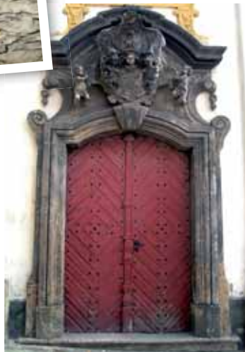
Ozdobné průčelí kostela sv. Vavřince