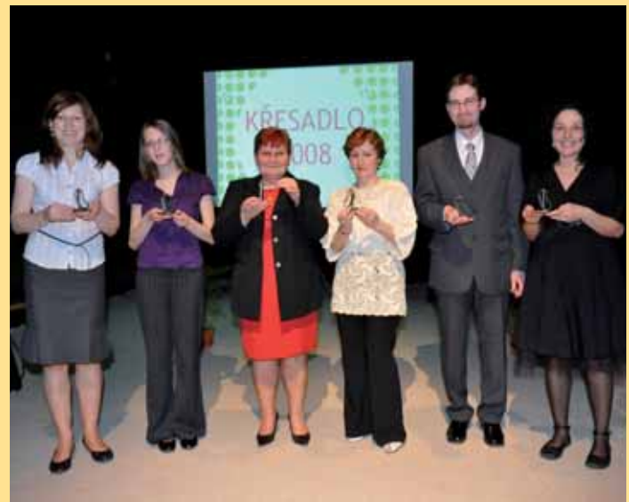
Ocenění dobrovolníci převzali cenu Křesadlo v Činoherním divadle.

Ústecký kraj | Křesadlo 2008 - Cena pro obyčejné lidi, kteří dělají neobyčejné věci, má své nové majitele. Umělecké repliky starožitných křesadel vyrobených křivoklátským kovářem Jaroslavem Zivalem převzali 11. března v Činoherním divadle v Ústí nad Labem.