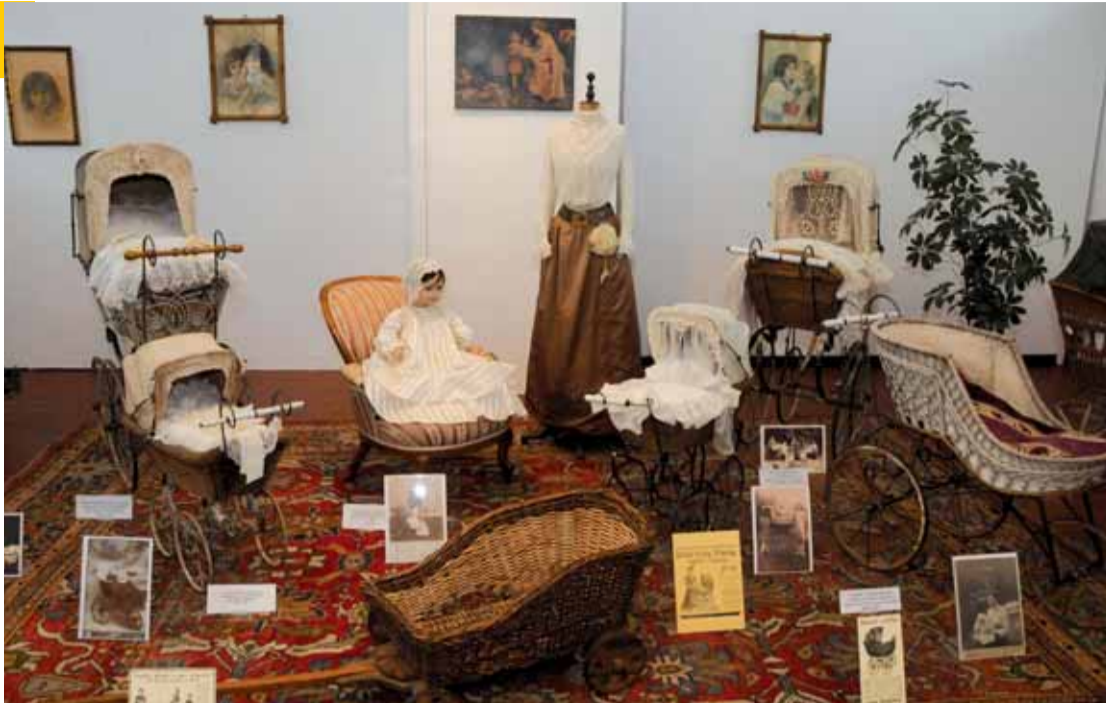
Historické kočárky jsou vystaveny v jízdně teplického zámku do 30. května.

Obyvatelé Ústeckého kraje ocení zvláště kočárky, které vzešly z některé ze zdejších továren. Na výstavě je prezentována například značka Karel Zörner z Loun či proslulá duchovská kočárkárna HIKO. Ta ve 20. letech minulého století nabízela velice praktický, a proto oblíbený, skládací