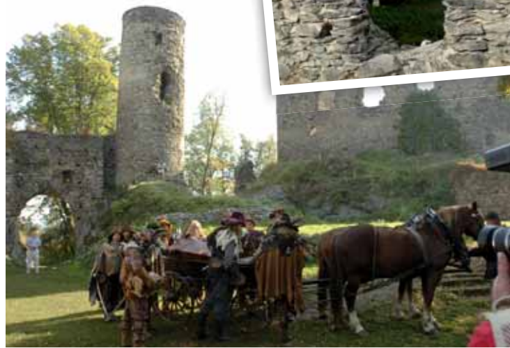
Režisér Zdeněk Troška zde natáčel pohádku Nejkrásnější hádanka.