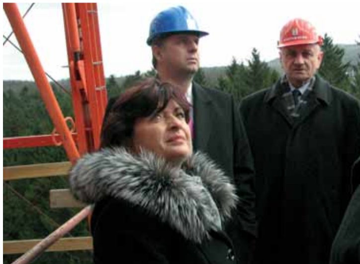
Ministr dopravy Petr Bendl (vedle hejtmanky Jany Vaňhové) na mostě v Mlékojedech.

Ministr při své návštěvě Ústeckého kraje 12. března totiž zavítal na staveniště mostu a poté si prohlédl i stavbu dálnice D8. Na obou stavbách ho doprovázeli hejtmanka Ústeckého kraje Jana Vaňhová a krajský radní pro dopravu Jiří Šulc. Stavba mostu, kterou mírně zpozdila mrazivá zima, nyní intenzivně pokračuje hlavně z litoměřické strany. Pokud bude dostatek finančních prostředků, mělo by dojít k přemostění řeky už na konci června a při zdárném pokračování dalších doprovodných akcí by mohl první automobil přejet nový most už letos v listopadu. Naopak, při krizovém scénáři s nedostatkem financí by byl generální dodavatel nucen stavbu zakonzervovat, což by podle jeho zástupců přineslo obrovské národohospodářské škody, které by byly mnohem vyšší než samotná dostavba díla. „To, že