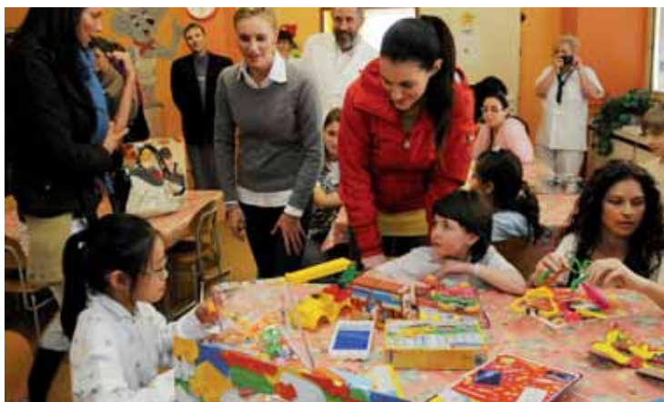
Modelky nepřišly za dětmi hospitalizovanými v Masarykově nemocnici, jež je součástí Krajské zdravotní, a. s., s prázdnou. Aby dětem pobyt v nemocnici lépe utikal, přivezly jim hračky.