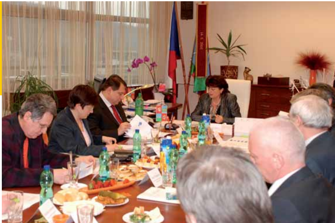
Jednání vedení Ústeckého kraje a sociálně demokratických poslanců a senátorů volených za Ústecký kraj.

Struktura rozpočtu a způsob, jak se úspěšně vyrovnat s předpokládaným poklesem rozpočtových příjmů, bylo podle šéfa sociálních demokratů dalším důležitým bodem jednání. Pokles průmyslové výroby podle Paroubka fatálním způsobem zasahuje do příjmů státního rozpočtu a zprostředkovaně i do příjmů krajů. „Jde o to, aby kraj byl schopen doporučit investiční akce, které si připravil,“ konstatoval a zmínil dopravní stavby, které se kvůli financím zpomalily.