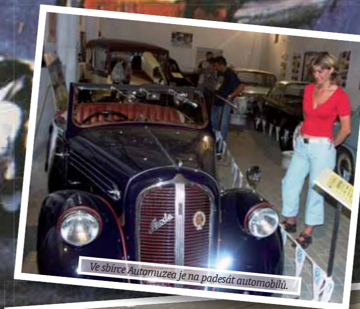
Ve sbírce Automuzea je na padesát automobilů.

Automuzeum je otevřeno od 1. května do konce října každou neděli od 10 do 16 hodin. Pro předem objednané skupiny (nad 10 osob) je možné domluvit návštěvu kdykoli. Navíc si lze objednat exkurzi do pivovaru, kde vás také rádi a zdarma provedou, i s ochutnávkou. (rd)