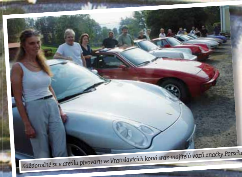
Každoročně se v areálu pivovaru ve Vratislavích koná sraz majitelů vozů značky Porsche.