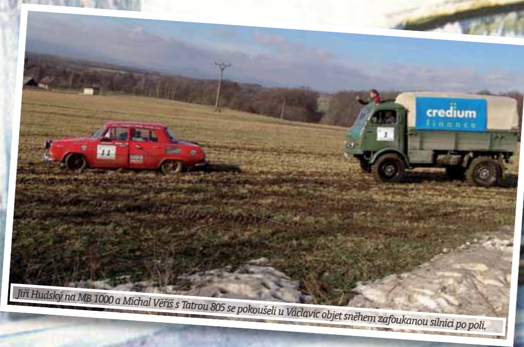
Jiří Hudský na MB 1000 a Michal Věřiš s Tatrrou 805 se pokoušeli u Václavic objet sněhem zafoukanou silnici po poli.

Text: Rudolf Dlouhý