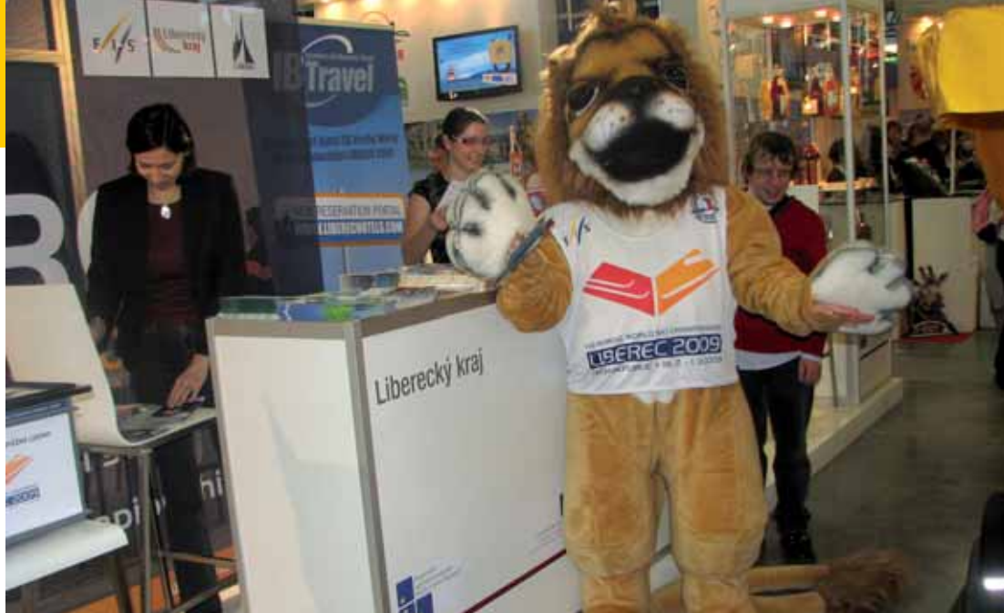
Maskot světového šampionátu v klasickém lyžování Lvíček Libi byl doménou jedné části expozice Libereckého kraje.

V řadě připravovaných akcí v letošním roce, které by měly pomoci v rozvoji regionální turistiky, jsme našli zajímavost ve stánku města Litoměřic. „Připravujeme velkou mezinárodní konferenci k regionálnímu cestovnímu ruchu, tedy k možnostem nabízeným