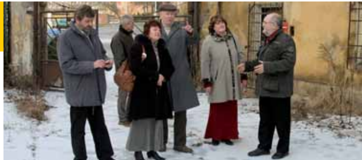
Pivovar navštívili zástupci německé strany, kteří zmapovali situaci a stav budov. Město připraví plán, jak by se dal pivovar zrekonstruovat a co by v něm mělo vzniknout.

„Jednali jsme hlavně o tom, co je ještě kulturní památka a co by se dalo případně odstranit. Dohodli jsme se, že naše požadavky sepišeme a do 6. února je zašleme na Ministerstvo kultury. Na jaře bychom již mohli znát výsledek. Zachovat by se měl střed pivovaru, komín a některé dominanty. Zůstat by mělo i historické průčelí. Naopak nevhledná budova přímo u komunikace by mohla zmizet. Jelikož plánujeme u pivovaru kruhový objezd, musí se vzhled také naplánovat v souladu s touto stavbou,“ sdělil starosta.