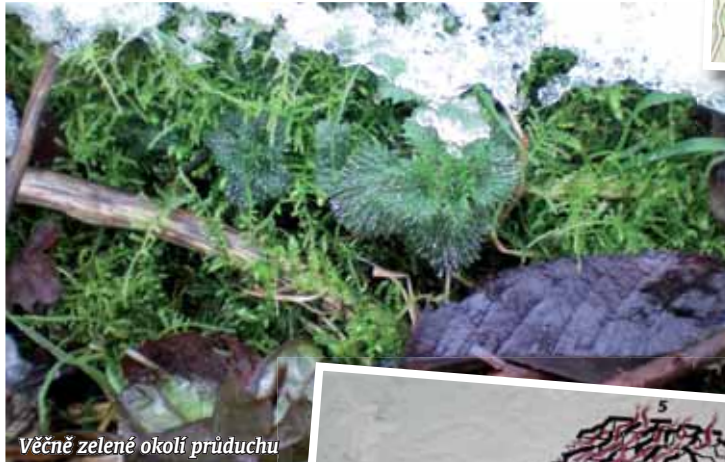
Věčně zelené okolí prúdechu