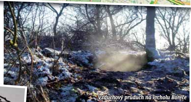
Vzduchový prúdech na vrcholu Boreče

s názvy jednotlivých kopců. Takže se tu můžeme také něčemu přiučit. V dřívějších dobách přisuzovali lidé komíny horkého vzduchu následku sopečné činnosti. Vědecké výzkumy však laickému pohledu přinesly pádné důkazy o mylné myšlence. Ve vycházejících parách nebyly naleze-