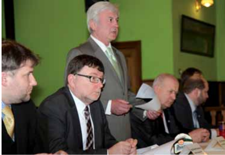
Na snímku zleva: generální ředitel ŘSD David Čermák, ministr dopravy Zbyněk Stanjura, starosta Veleminy Jiří Skalický, hejtman Ústeckého kraje Oldřich Bubeníček a radní pro dopravu ÚK Jaroslav Komíněk.

„Dostavba může nyní probíhat plným tempem, zpoždění stavby v důsledku nedostatku financí nehrozí,“ zopakoval před starosty ve čtvrtek 4. dubna ministr Stanjura. Zdůraznil, že problémem českých silnic není nedostatek peněz, ale jejich nedostatečná příprava a způsob výstavby. Dálnice D8 se aktuálně týká 16 neuzavřených soudních sporů. Přesto po jednání s ministrem panoval