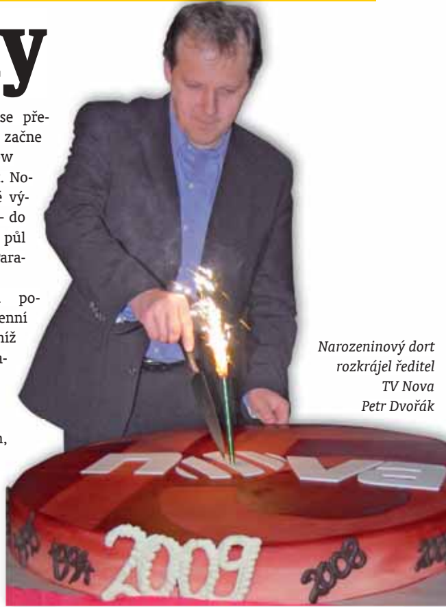
Narozeninový dort rozkrájel ředitel TV Nova Petr Dvořák

přinese? Nechte se překvapit. Od března začne IV. řada reality-show Výměna manželek. Novinkou budou dvě výměny zahraniční - do Řecka a dokonce i půl světa vzdálené Paraguaye. Čtvrtou sezonou pokračuje i každodenní seriál Ulice, v níž se Lumír Nykl zaplétá stále hloub do osidel mafie a Vlastimil Pešek bojuje s obviněním, že donášel StB. Poslední únorový den opanuje obrazovku čistá ženská krása - v přímém přenosu z Terminálu 2 Letiště Praha