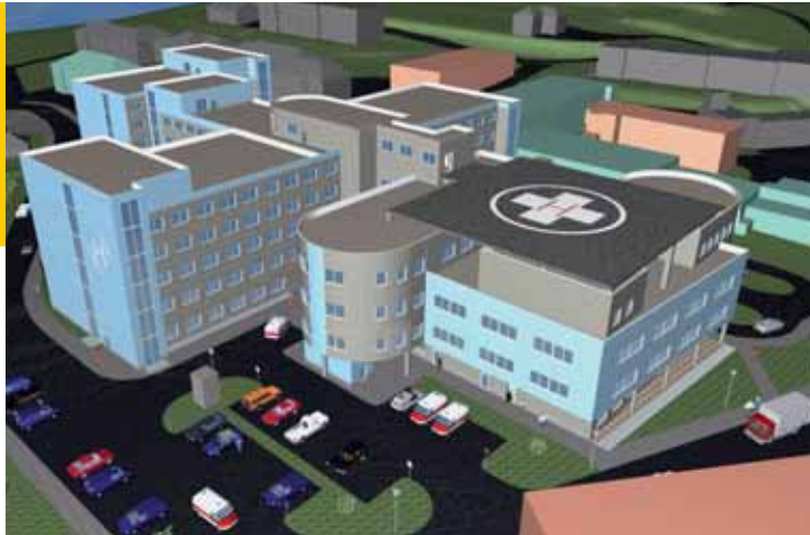
Pohled do roku 2011 kdy bude dostavena nemocnice v Klatovech. Jednou ze změn proti původnímu plánu je umístění heliportu pro leteckou záchranku na střeše budovy.

Původní projekt nemocnice byl upraven na základě požadavků vedoucích lékařů a managementu stávající klatovské nemocnice. Tím došlo k rozšíření celé stavby a nezbytnosti provést změny územního rozhodnutí, stavebního povolení a odstranění některých staveb. Změny vycházely z vlastních požadavků