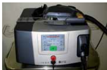
Epilacní laser LEDA = malá krabička s velkými výsledky

Na podzim loňského roku uvedli lékaři plzeňského Kosmetického laserového centra VS LASERA jako první na světě do provozu bezkonkurenčně nejrychlejší laserový systém LEDA umožňující účinnější, kratší a levnější epilace. Díky čtyřem vysokovýkonným epilacním laserům (2x LEDA, MYDON, RUBIN) se LASERA řadí mezi nejlépe vybavená epilacní pracoviště v Evropě.