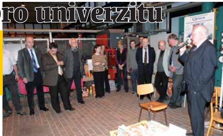
Na snímku rektor Západočeské univerzity v Plzni Josef Prusa, který ocenil výsledky studentů.

Centrum vytváří prostředí pro studenty, kteří se mohou zapojit do zpracování unikátních projektů, vyzkoušet své nápady a nekonvenční technické myšlenky. Fortech vyvinul řadu zajímavých řešení, mezi nimiž jsou i světové unikáty, například zařízení pro modelování velmi složitých technologií. Výsledky FORTECHU byly oceněny řadou prestižních cen v Čechách i v zahraničí. „Absolventi, kteří odtud odchá-