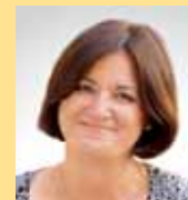
Helena Langšádlová, poslankyně TOP 09

však za zásadní pro změnu přístupu obyvatel této země k jejich aktivnímu zapojení se do správy veřejných záležitostí. Zcela jistě přijde všeobecné rozčarování nad důsledky této volby, nicméně jak jinak má národ a lid najít vztah a zejména osobní zodpovědnost jednotlivce za chod společnosti? Doufám, že rozhodování formou referenda a tedy i přímé volby prezidenta bude první z krůčků, po kterých dojdeme k přímé a otevřené demokracii. K přijetí zodpovědnosti jednotlivce za své osobní činy i jako jeho nedílné součásti společnosti a zodpovědnosti společné. Zatím tomu tak není a většina z nás svádí špatný stav naší země jen na politiky. Je to naivní a dětské a ukazuje to jen na naši neochotu přiznat si svou spoluzodpovědnost, ale také práva a povinnosti.