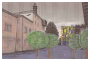
Zadní nádvoří s novostavbou