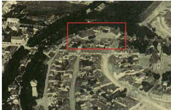
Letecký snímek z dvacátých až třicátých let 20. století.