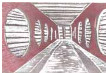
Dětský svět / počítačové centrum

řen s možností vybudovat například tržnici s regionálními produkty.