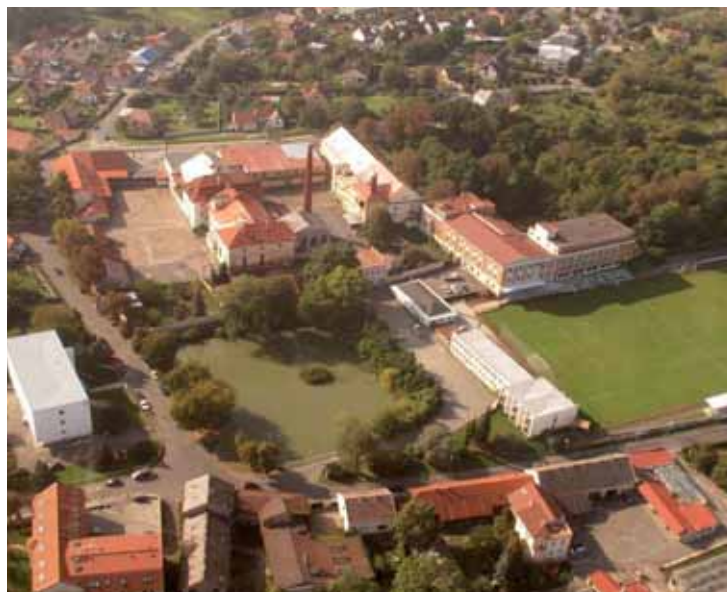
Letecký snímek pivovaru Kutná Hora

řen s možností vybudovat například tržnici s regionálními produkty.