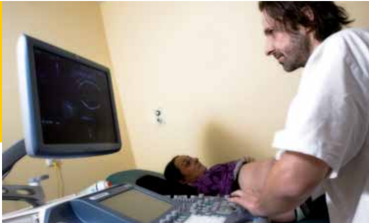
Všechno, co děláme, děláme pro budoucí maminky. Říkají si v Porodnicko-gynekologické klinice Fakultní nemocnice Ostrava.

Možnost diagnostikovat vrozenou vývojovou vadu nebo patologické těhotenství je díky lepším rozlišovacím schopnostem nového přístroje větší, a to již v průběhu prvního trimestru gravidity. Běžně se provádí kevní odběr u matky v 16. týdnu těhotenství a potom okolo 20. týdne následuje podrobné ultrazvukové vyšetření. „V současné době se do praxe stále více prosazuje modernější screeningové vyšetření, které je možno provést již mnohem dříve. Budoucí maminka může absolvovat odběry krve a vyšetření na kvalitním ultrazvuku už nejpozději do 14. týdne gravidity. Úspěšnost odhalení