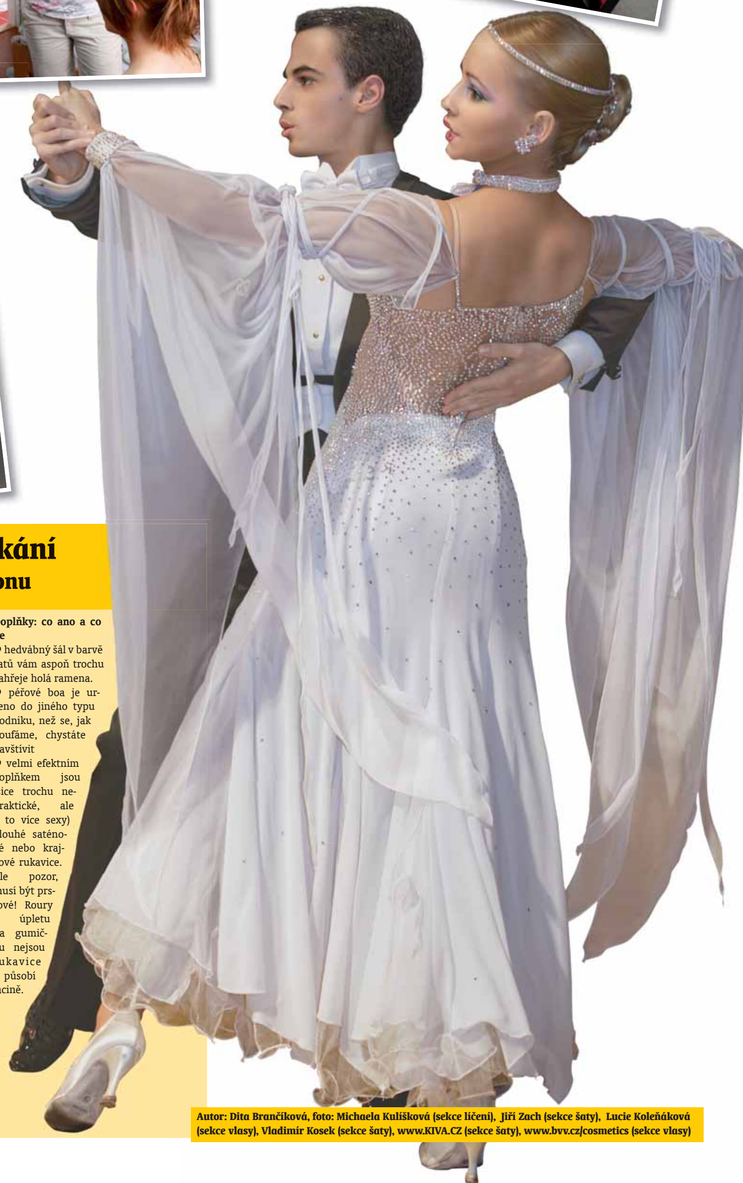
Autor: Dita Brancíková, foto: Michaela Kulišková (sekce líčení), Jiří Zach (sekce šaty), Lucie Koleňáková (sekce vlasy), Vladimír Kosek (sekce šaty), www.KIVA.CZ (sekce šaty), www.bv.cz/cosmetics (sekce vlasy)