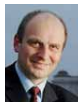
Petr Gandalovič, ministr zemědělství

Novoroční předsevzetí si nedávám. Pokud člověk má osobní potřebu něco ve svém životě měnit, má to udělat hned a ne čekat až na příchod nového roku. Sobě i všem čtenářům přeji dobrý rok 2009. Já za sebe se budu ve své funkci snažit, abych dál naplňoval cíle, se kterými jsem do politiky vstupoval – tedy hájit svobodu a každého z nás a v rámci možností spoluřešit současnou finanční a ekonomickou krizi.