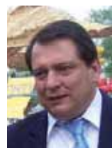
Jiří Paroubek, předseda ČSSD

Myslím, že soulovím „novoroční předsevzetí“ dnes zavání spíše tím, že je to něco, co se v zásadě nesplní, nebo splnit nepodaří. Nejen proto si žádná novoroční předsevzetí nedávám. Chtěl bych, aby se mi v pracovním a osobním životě vedlo jako doposud a samozřejmě, aby mé vedení ČSSD vedlo k podobným úspěchům, jako v roce 2008.