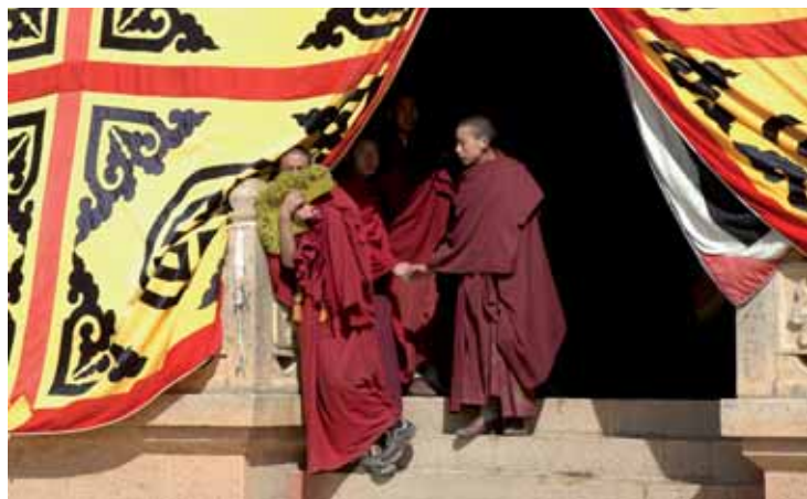
Mniši z tibetského kláštera.