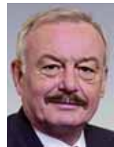
Přemysl Sobotka, předseda Senátu ČR

Myslím, že soulovím „novoroční předsevzetí“ dnes zavání spíše tím, že je to něco, co se v zásadě nesplní, nebo splnit nepodaří. Nejen proto si žádná novoroční předsevzetí nedávám. Chtěl bych, aby se mi v pracovním a osobním životě vedlo jako doposud a samozřejmě, aby mé vedení ČSSD vedlo k podobným úspěchům, jako v roce 2008.